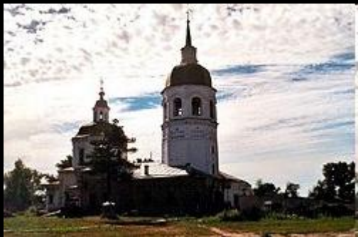
Церковь Преображения Спасителя, около 1750

Енисейск долгое время был культурным центром Енисейской губернии.