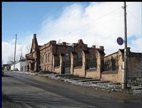
Аптека в Енисейске

Енисейск был крупным центром иконописного искусства. В 1669 году в городе работали пять иконописцев. В 1760 — 1780-х годах были известны енисейские иконописцы Григорий Кондаков и Максим Протапопов.