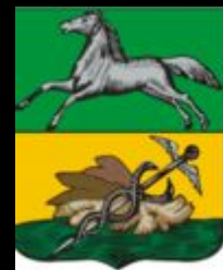
Герб 1804 года