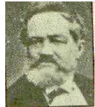
А. Ф. Миддендорф (1815-1894 гг.)