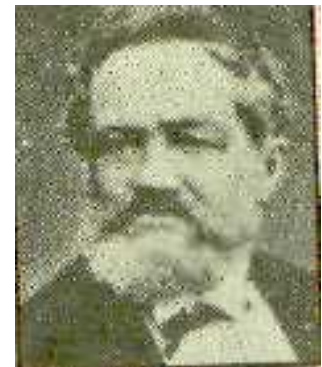
А. Ф. Миддендорф (1815-1894 гг.)