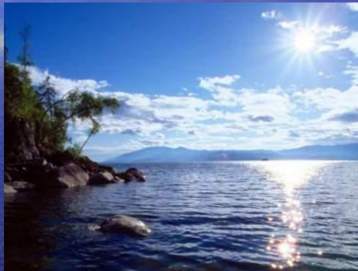
Исток реки Волга