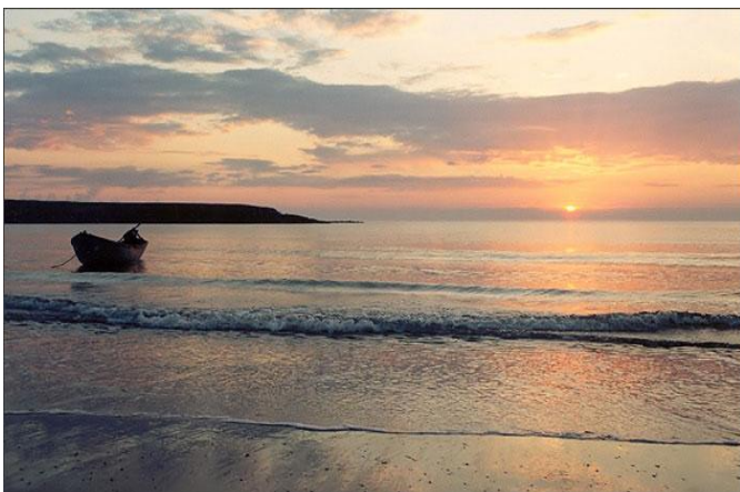
Незамерзающее Баренцево море