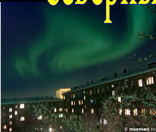
Полярная ночь. Северное сияние