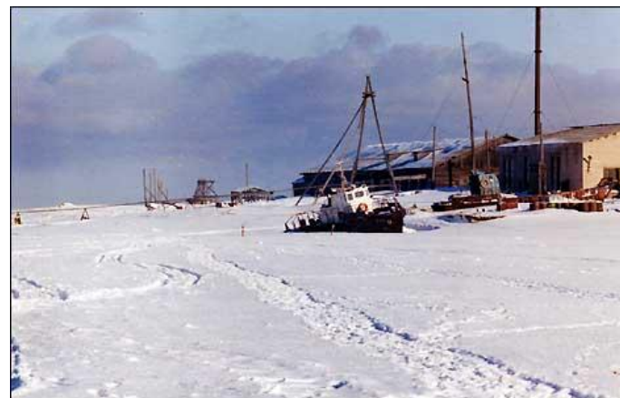
Замерзающее Белое море