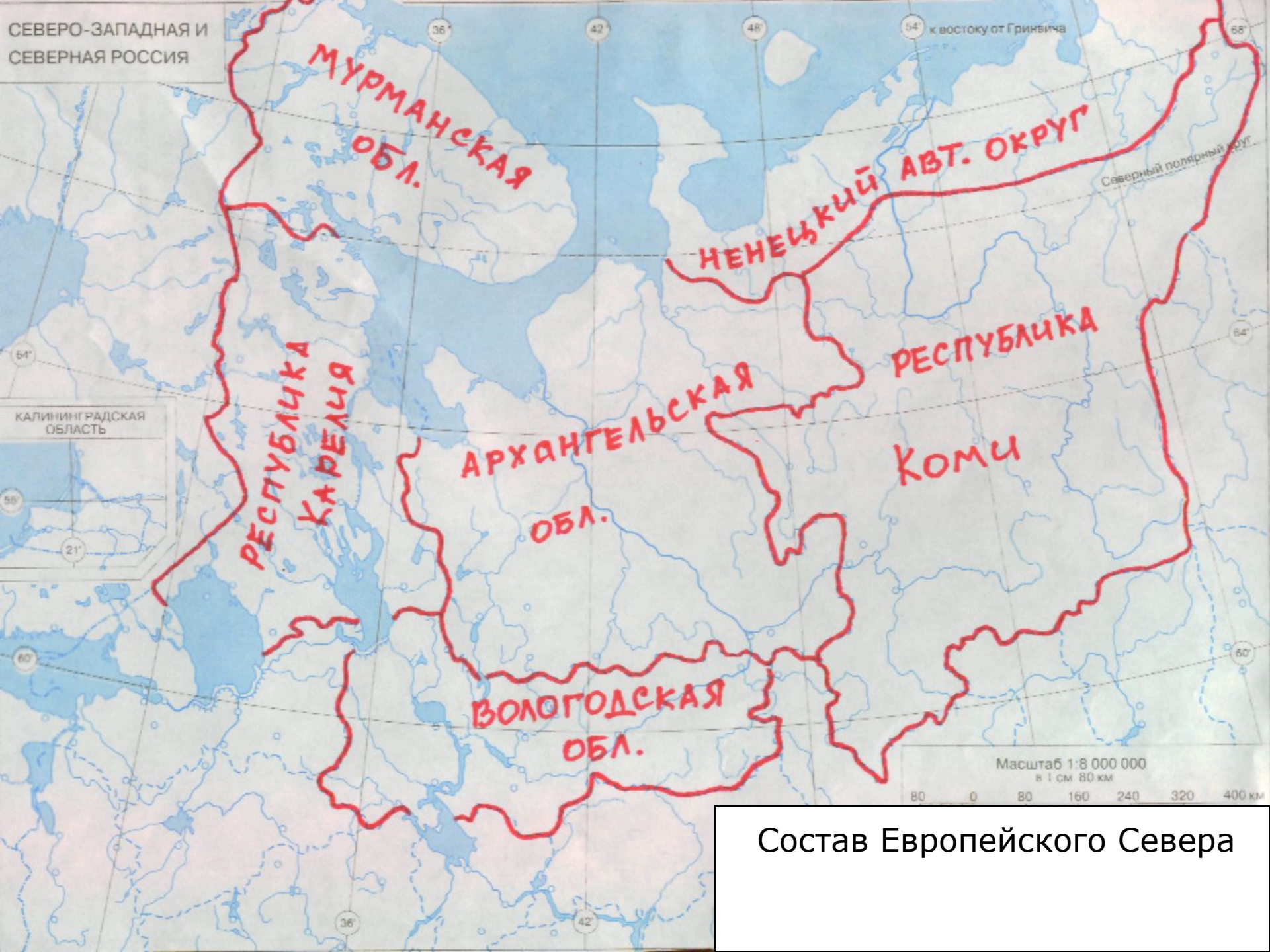
Состав Европейского Севера