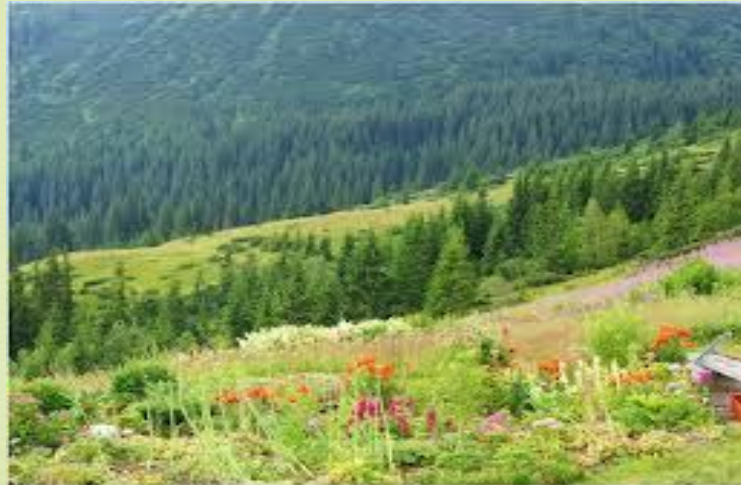
Петік Оксани ОА-12