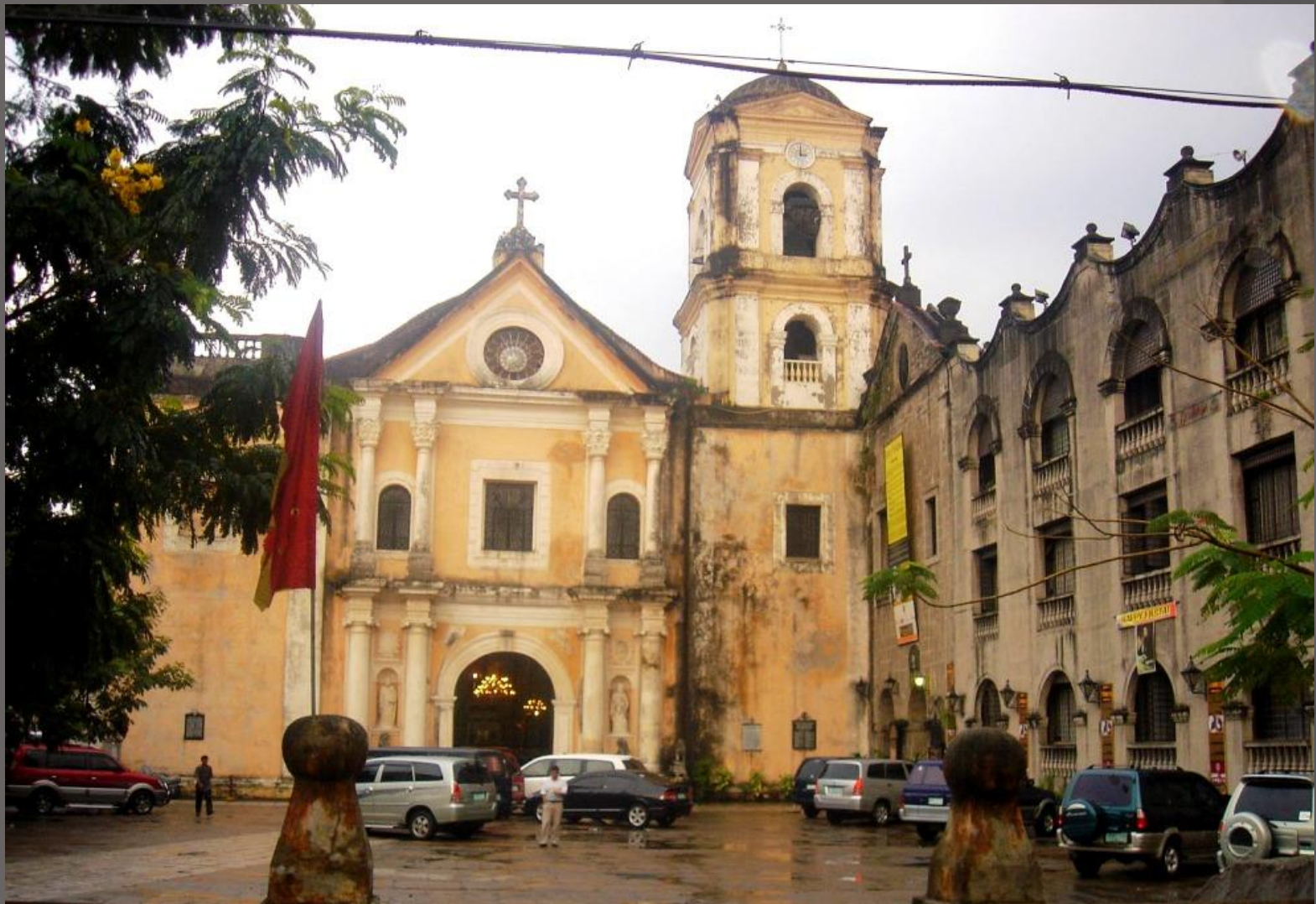
Церковь Святого Августина