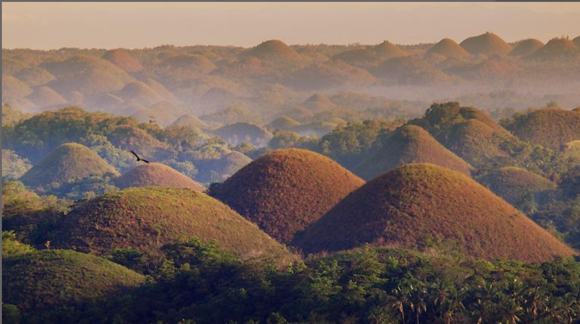
шоколадные холмы бохол