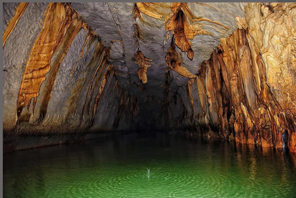
подземная река пуэрто-принсеса