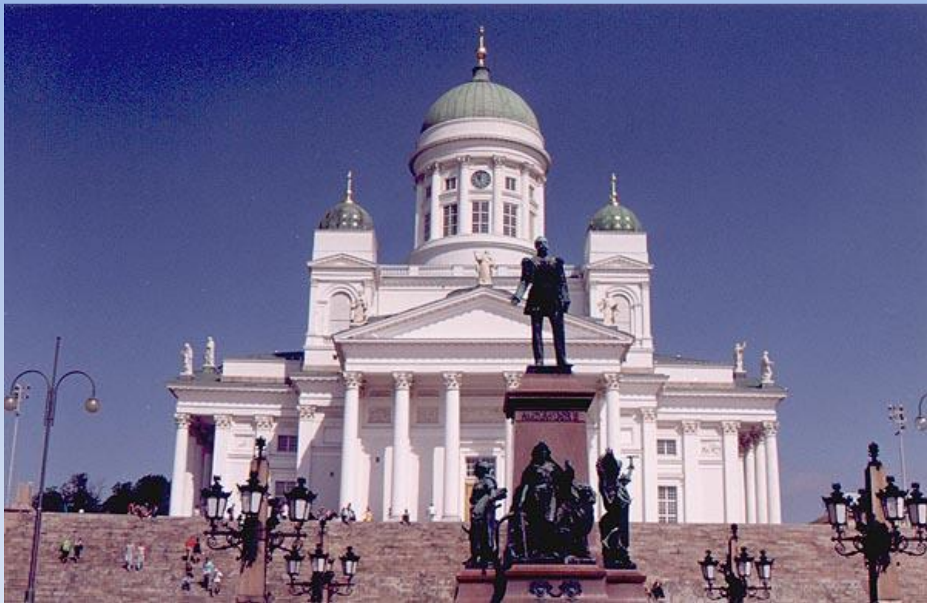
Памятник Александру II на Сенатской площади в Хельсинки