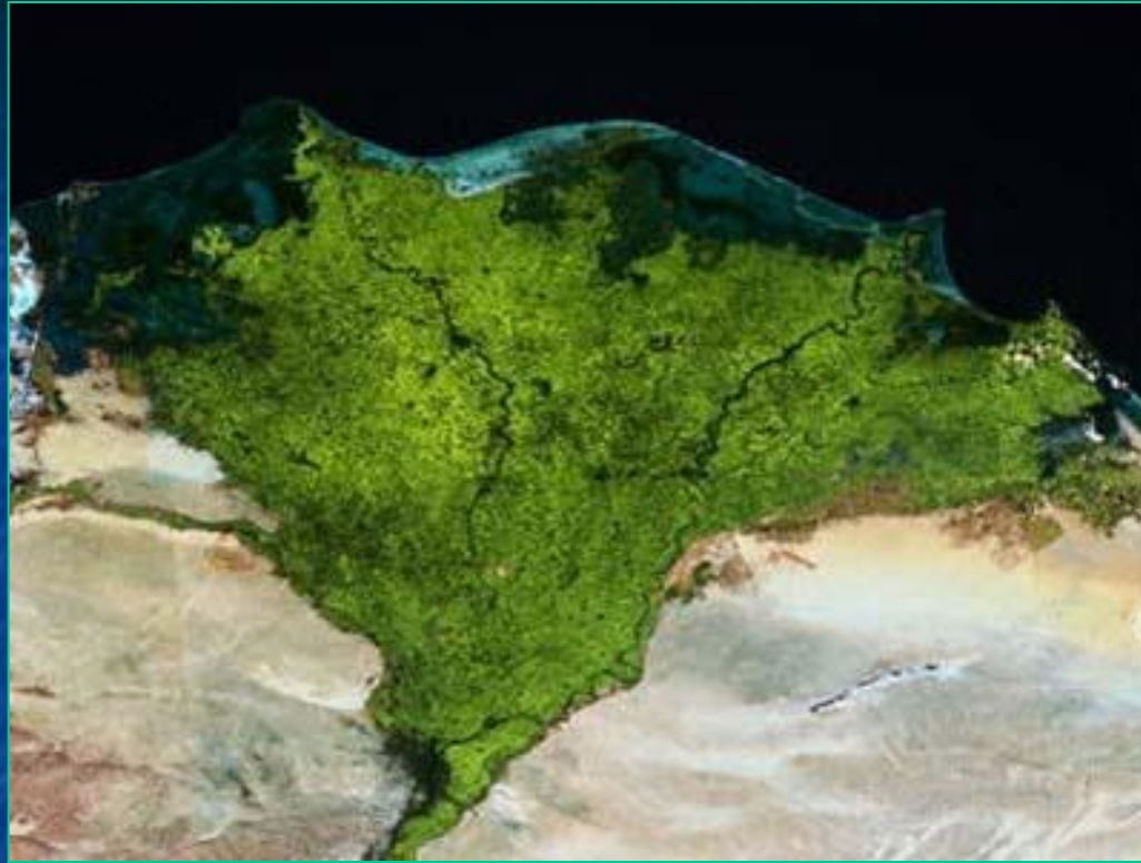
Дельта реки Нил. Фото из космоса.

В Африке протекает самая полноводная река восточного полушария и самая длинная река мира. ( Конго и Нил ).