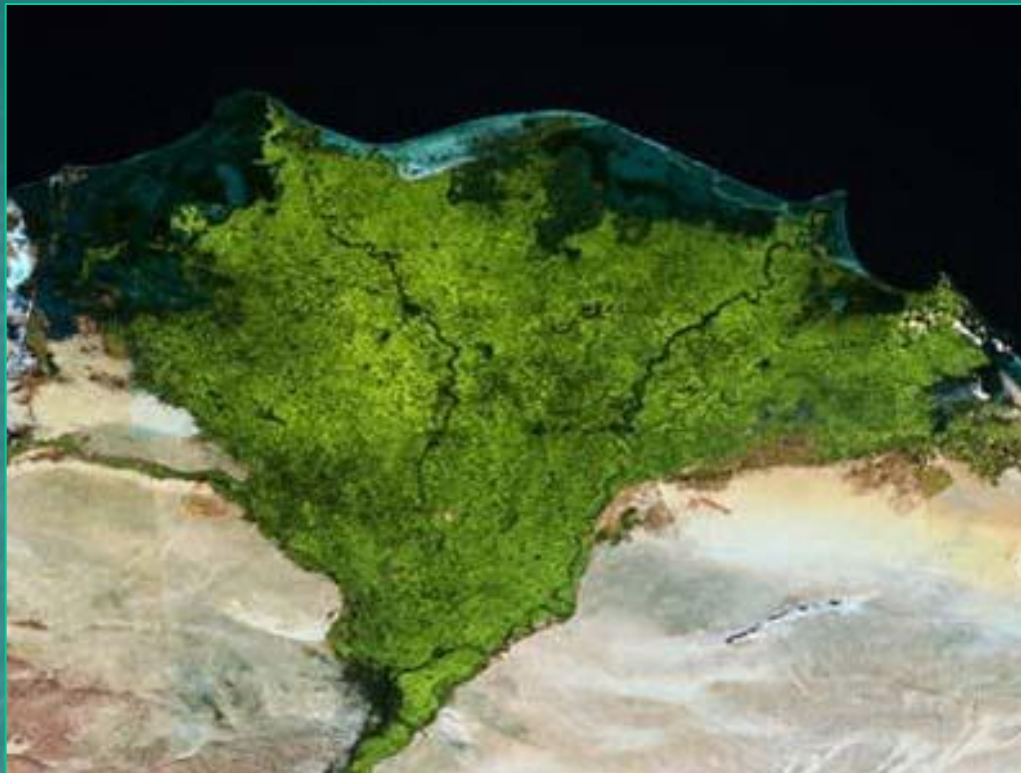
Дельта реки Нил. Фото из космоса.

В Африке протекает самая полноводная река восточного полушария и самая длинная река мира. ( Конго и Нил ).