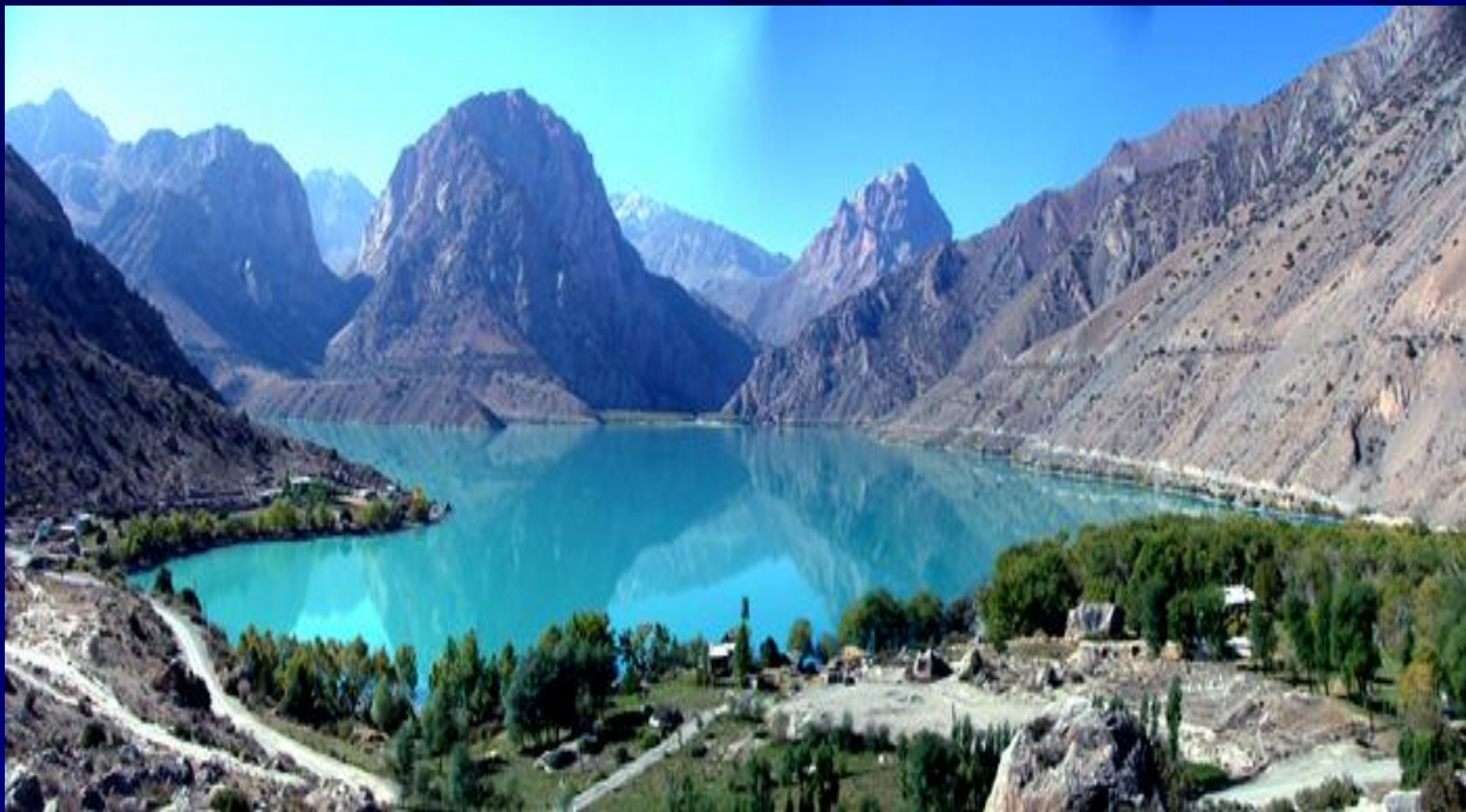
Панорама озеро Искандеркул