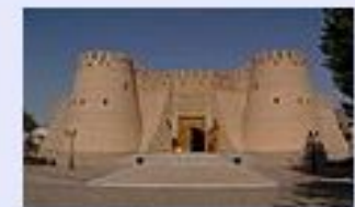
Исторический музей город Худжанд