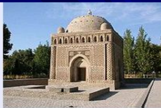
Мавзолей Исмоила Сомони в Бухаре