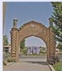
Арка в Истаравшане