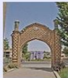
Арка в Истаравшане