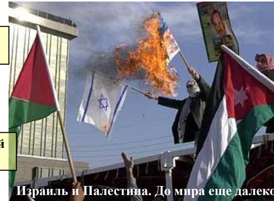
Израиль и Палестина. До мира еще далеко.