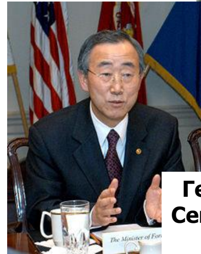
Генеральный Секретарь ООН с 2007 г. Пан Ги Мун

«Дуга нестабильности» - проходящая от Британских островов через Среднюю Европу, Балканы, Кавказ, Памир, Гималаи к Индонезии и островам Зондского архипелага.