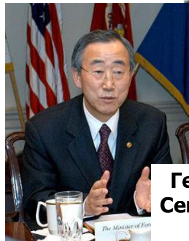
Генеральный Секретарь ООН с 2007 г. Пан Ги Мун

В настоящее время, в связи с ослаблением роли России и претензии США на то, чтобы стать единственной супердержавой современного мира, число конфликтов в регионе существенно увеличилось.