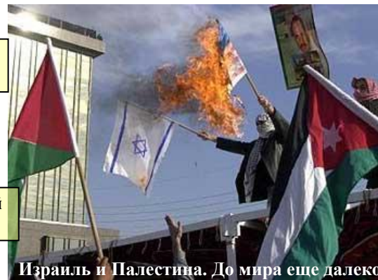
Израиль и Палестина. До мира еще далеко.