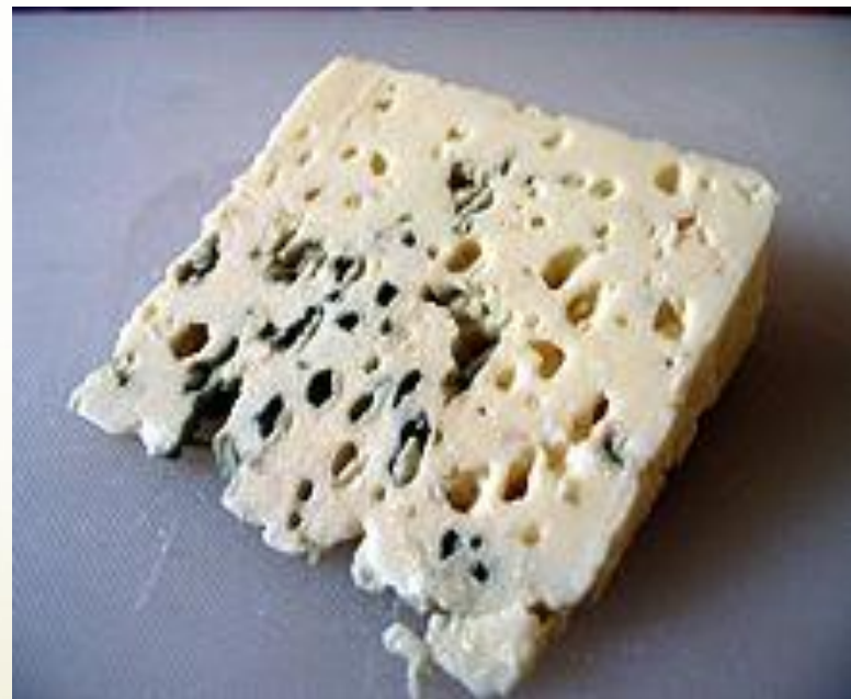
Сыры (камамбер, бри, рокфор).