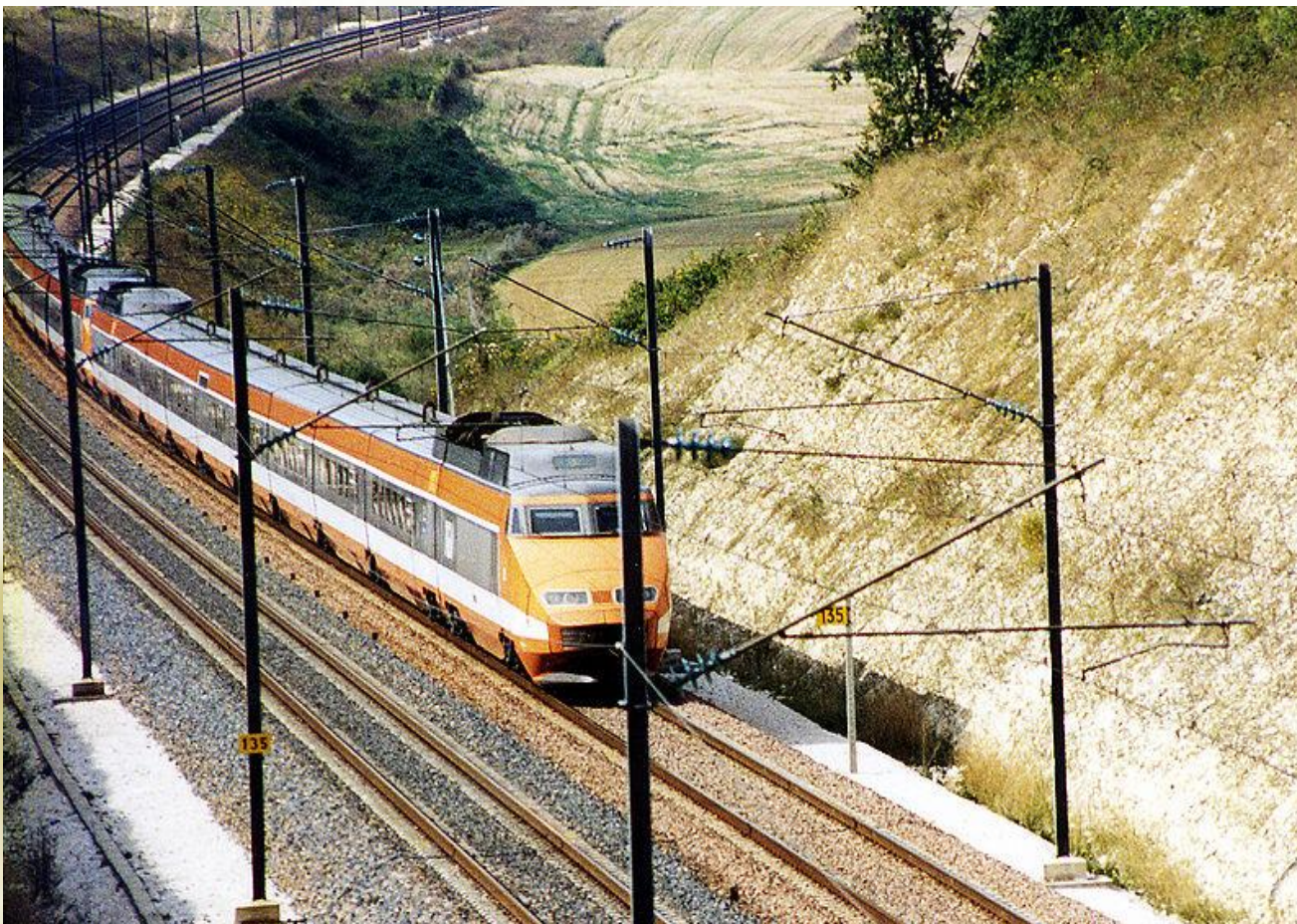
Поезд TGV PSE на линии Париж—Лион.