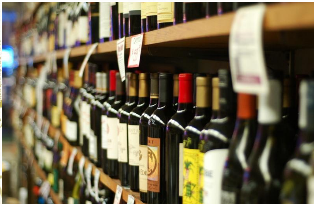
Вина (бордо, божоле нуво, шампанское).