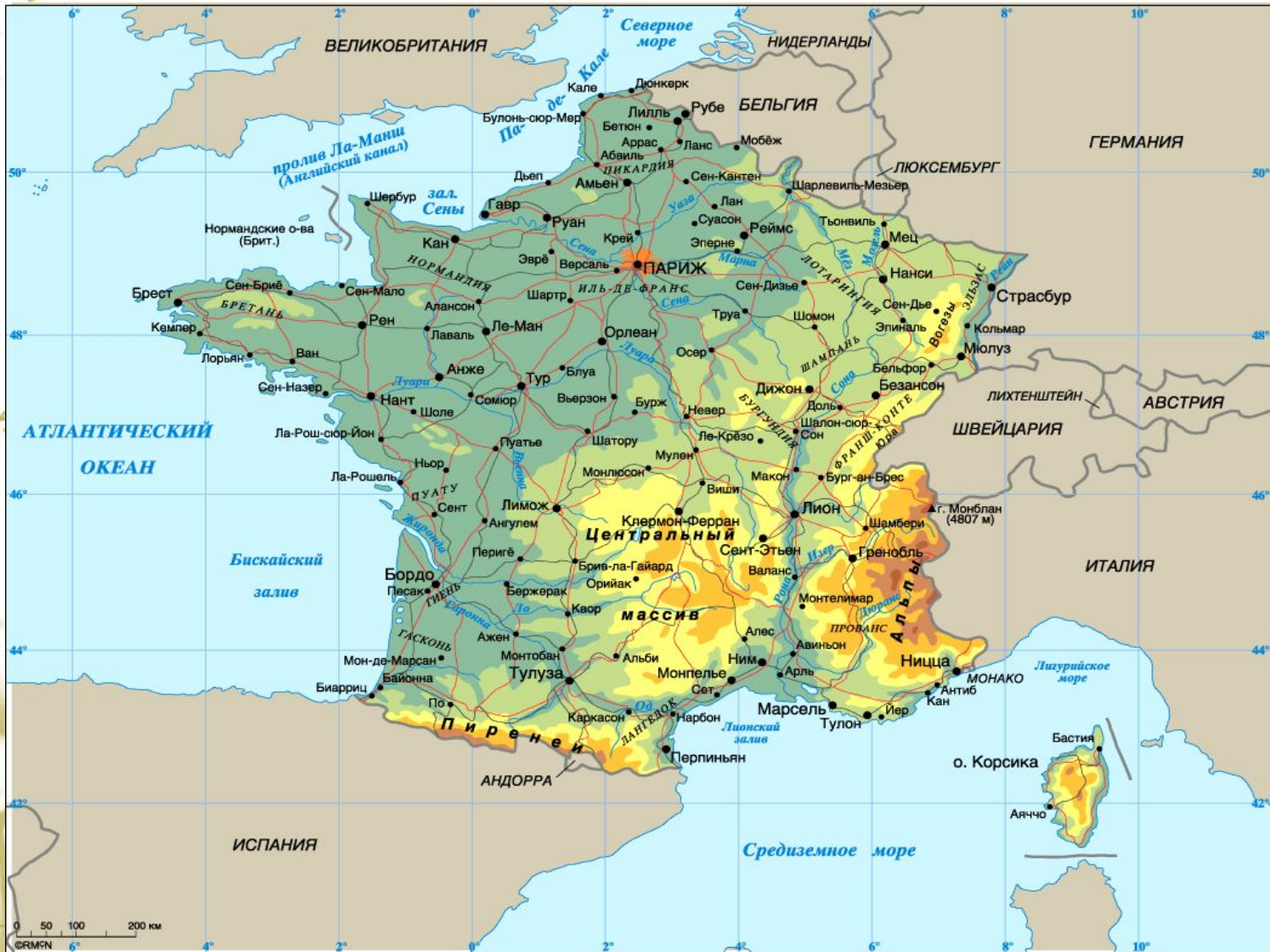
Франция на карте.