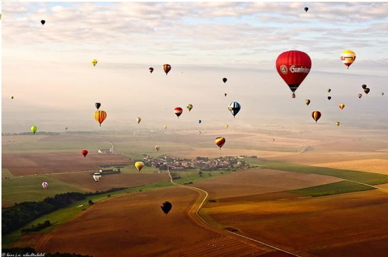
Фестиваль воздушных шаров во Франции.