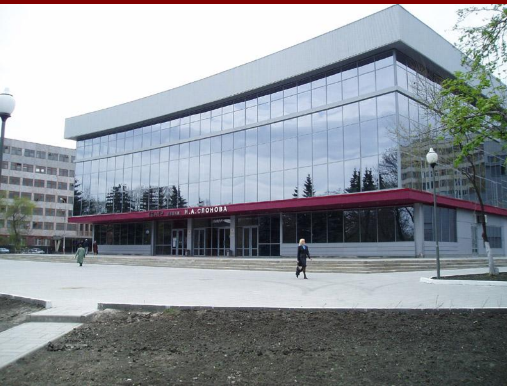
Театр Драмы им. И.А. Слонова