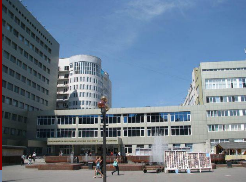
Саратовский государственный аграрный университет им. Н.И. Вавилова