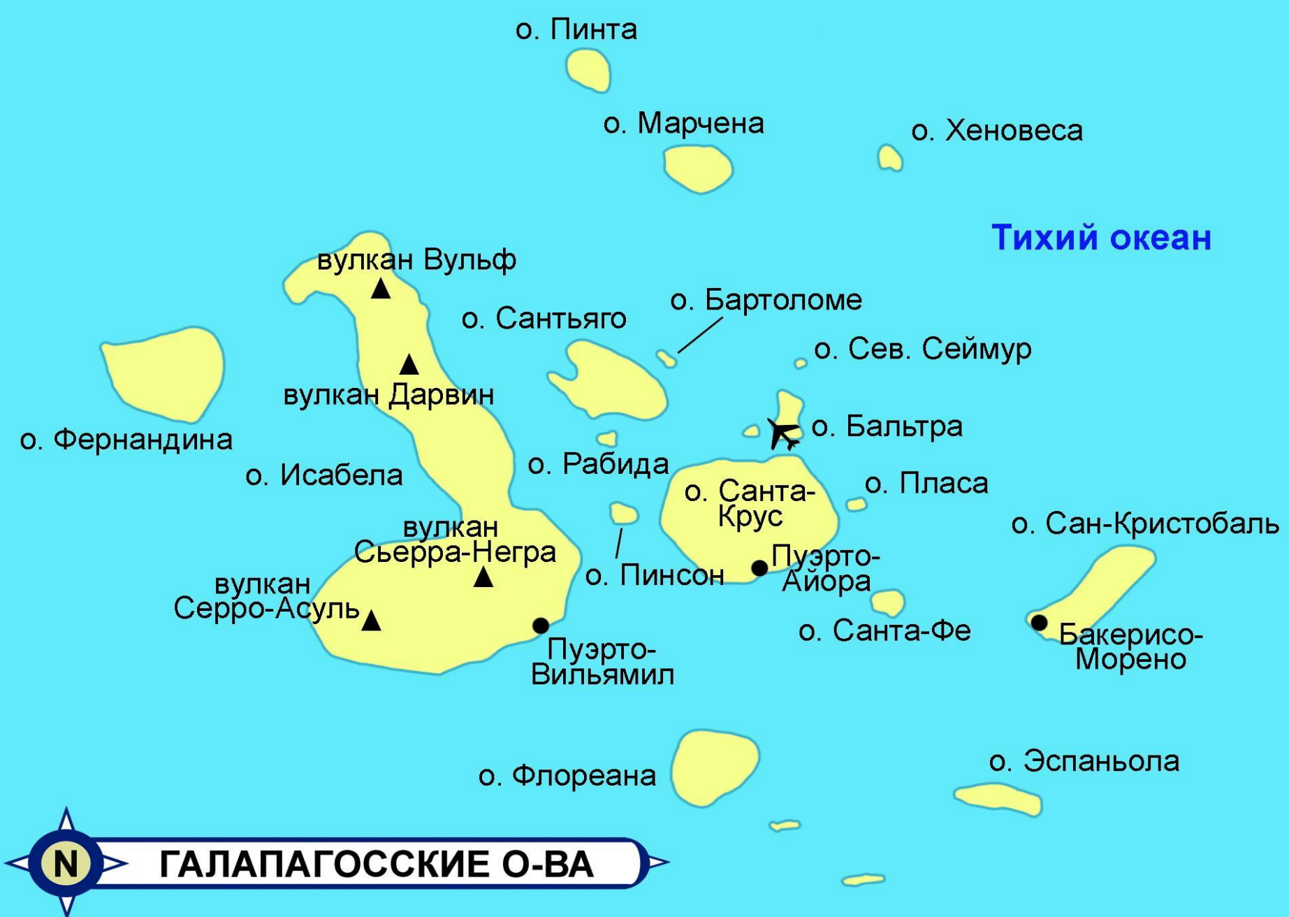
N ГАЛАПАГОССКИЕ О-ВА