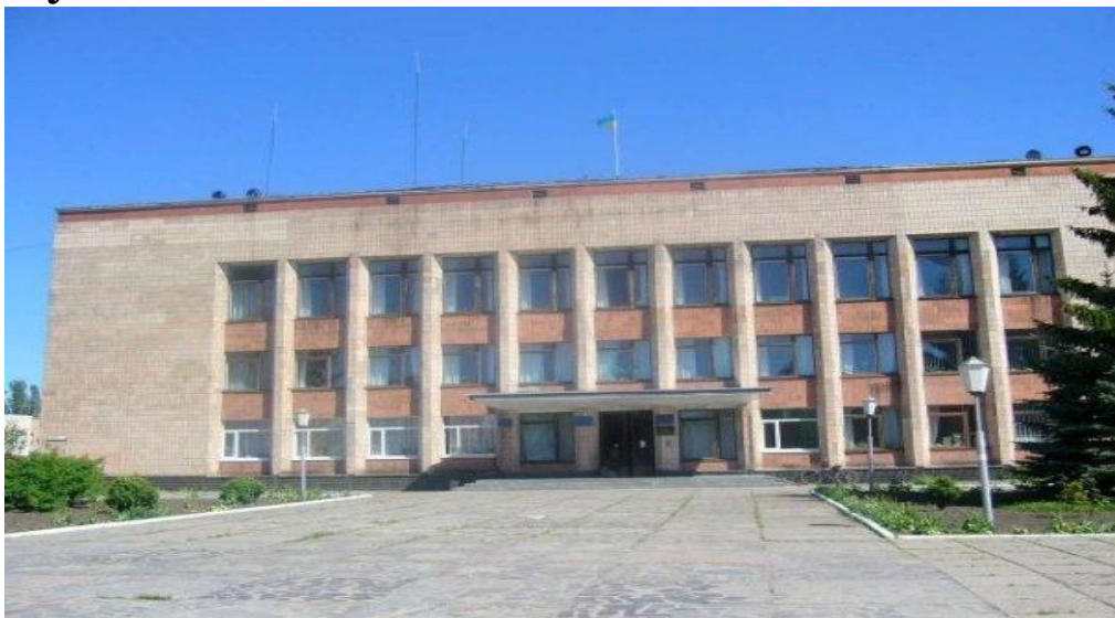
Районна Державна Адміністрація

Культурно-освітню роботу проводять 29 клубних установ і будинків культури, кінотеатр, понад 30 бібліотек, мистецька і музична школи.