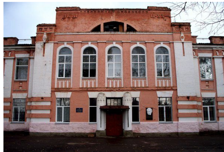
Христинівська спеціалізована школа I-III ст. №1 ім. О.Є. Корнійчука