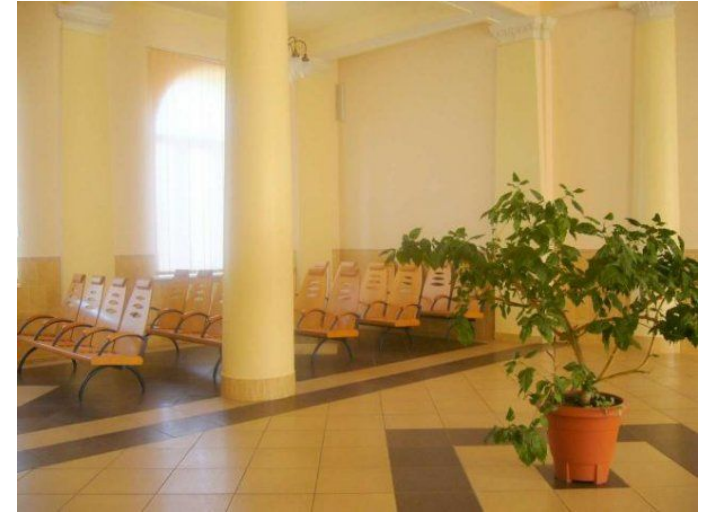
Залізничний вокзал з 1950 р.