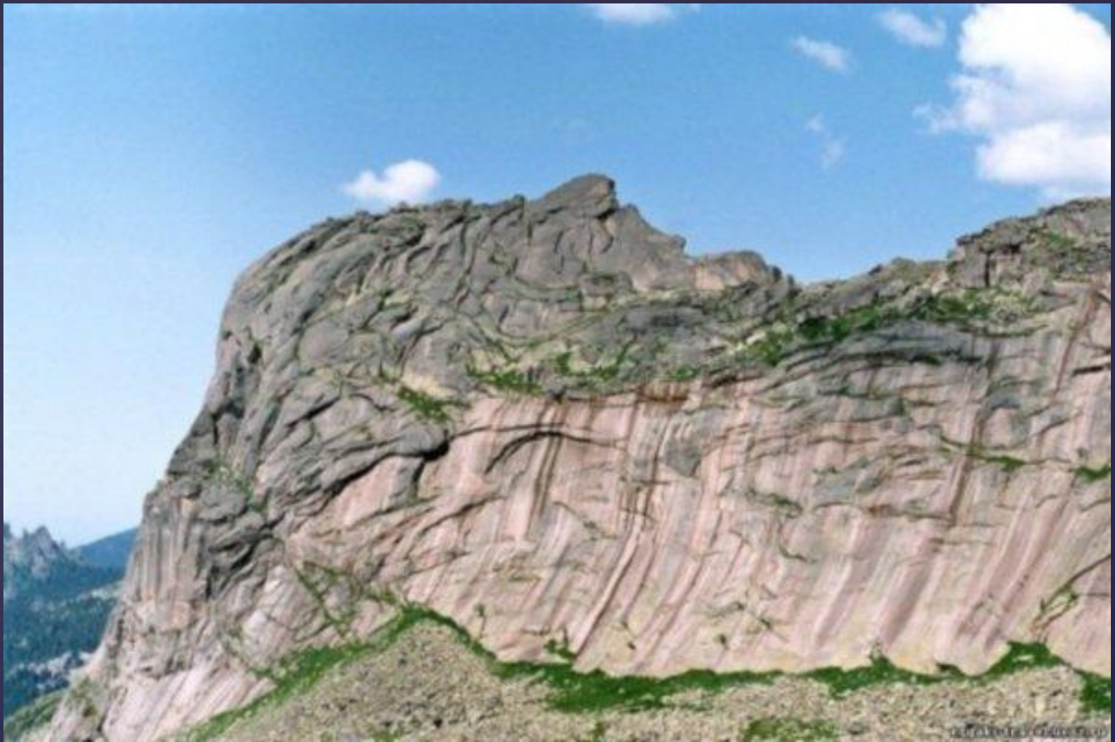
Скала «Спящий Саян» в горной системе Западного Саяна