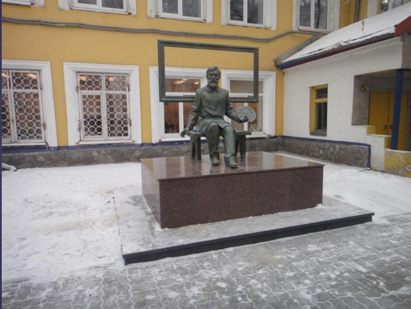
Памятник художнику Д. Каратанову во дворе художественной школы в г. Абакан Республики Хакасия