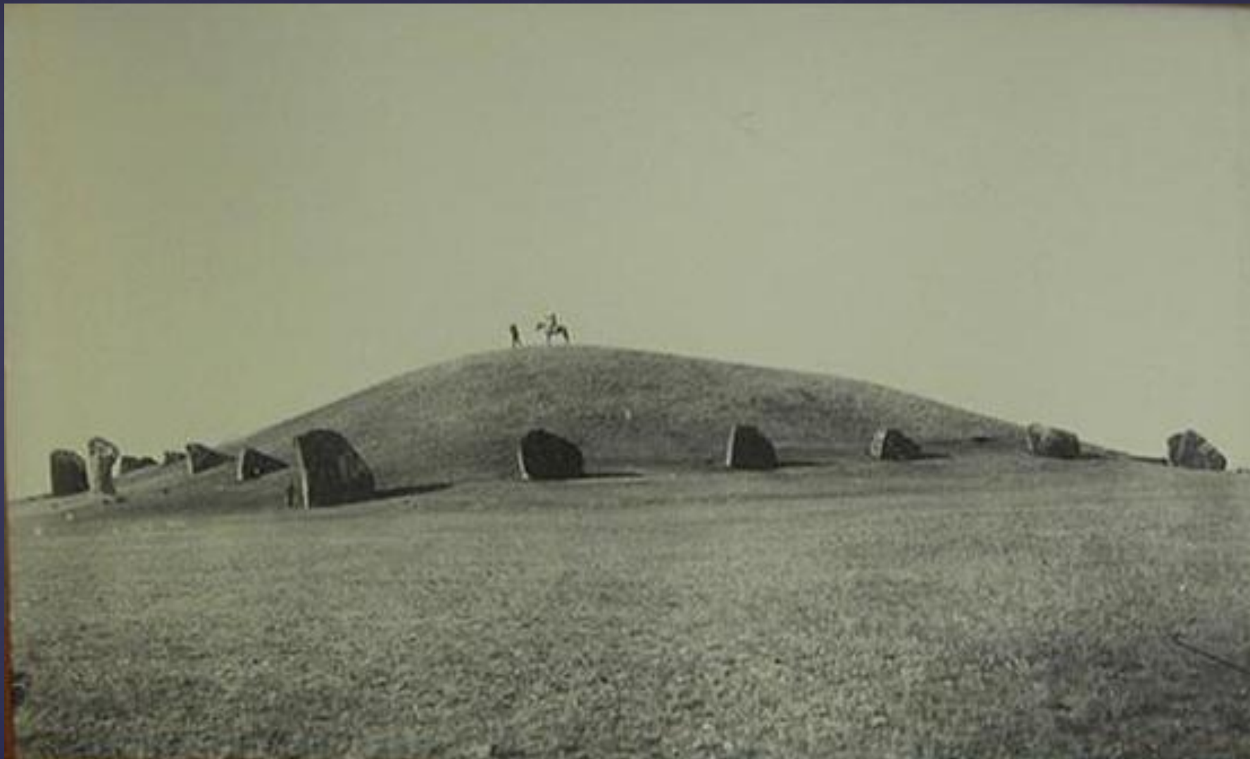
Салбыкский курган в Хакасии