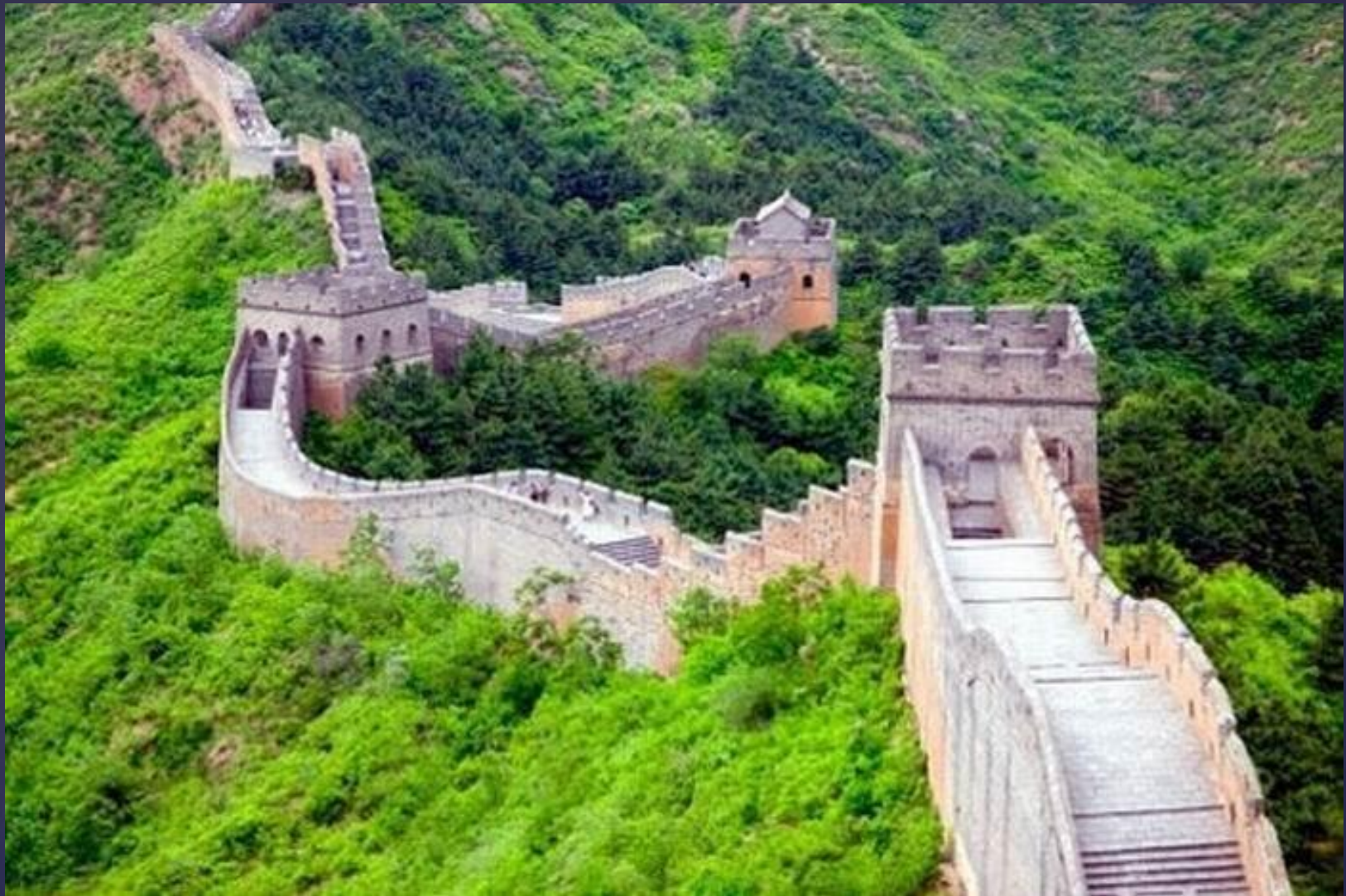
Великая китайская стена