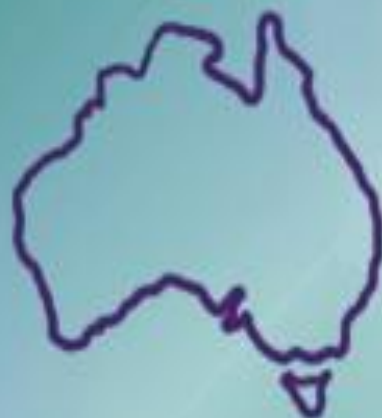
АВСТРАЛИЯ и ОКЕАНИЯ