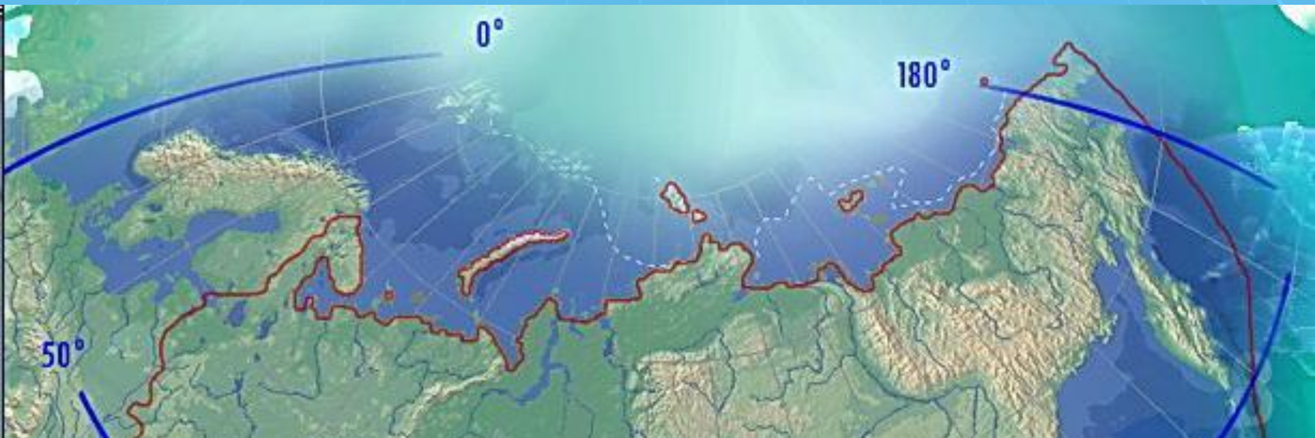
Доля территории России по широтным зонам