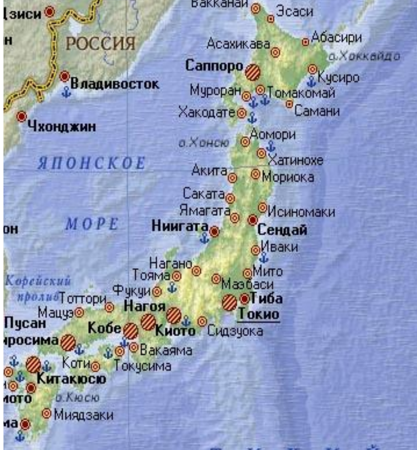
карта Япони и