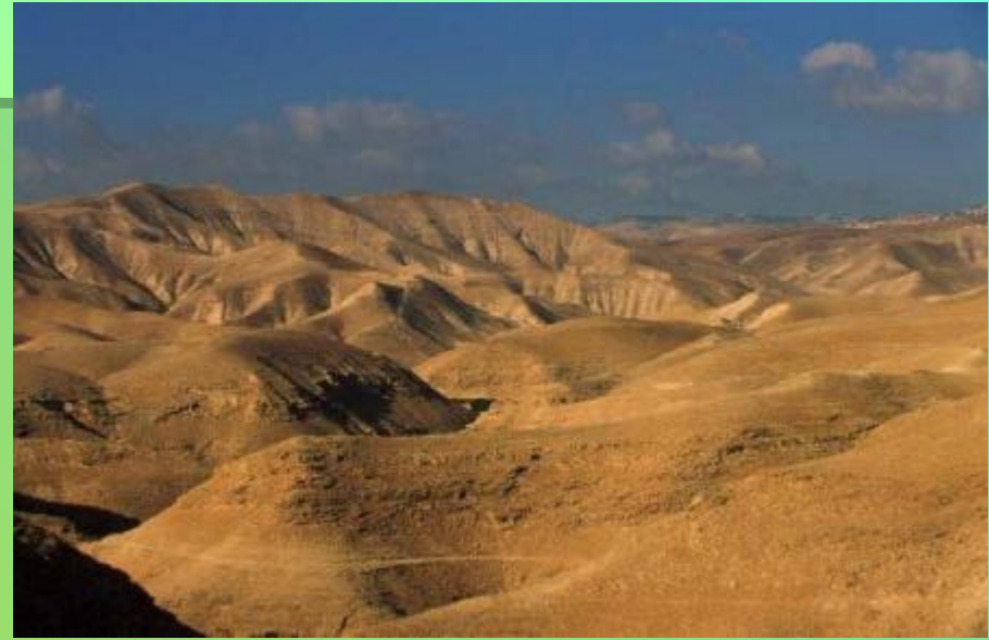
Пустыня в Израиле.