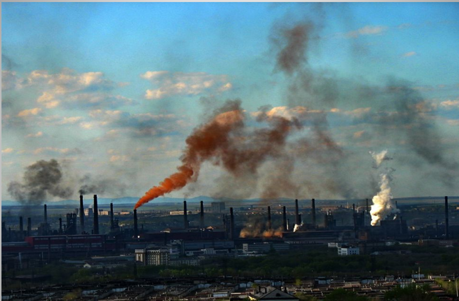
Магнитогорский металлургический комбинат