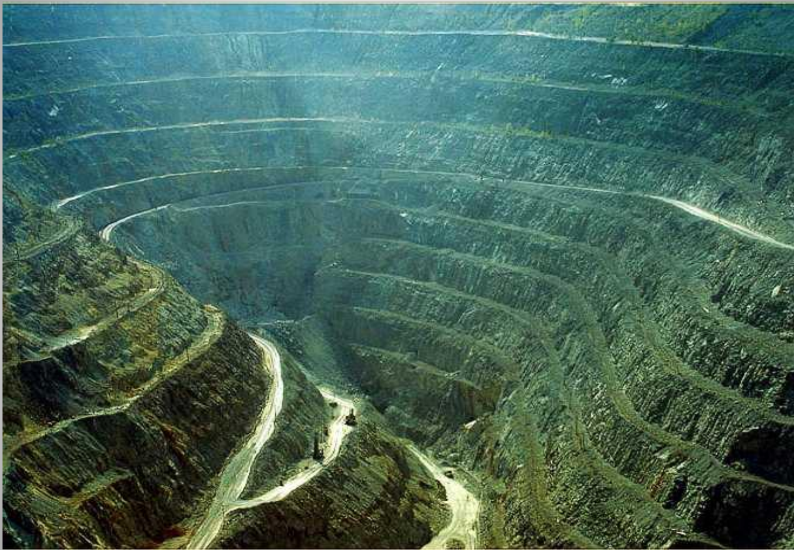
Добыча медной руды открытым способом