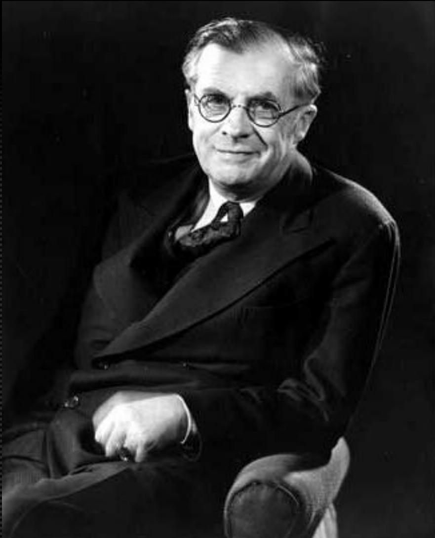
Дж. Хаксли (1887–1975 )