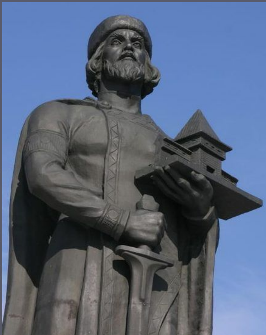
Памятник Ярославу Мудрому