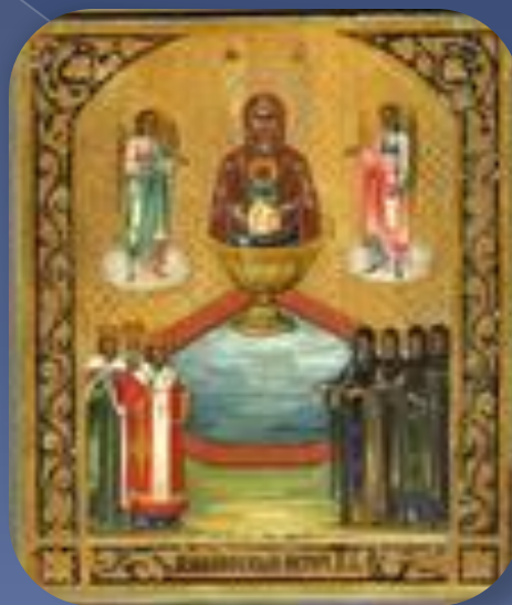
Святые иконы поволжских храмов