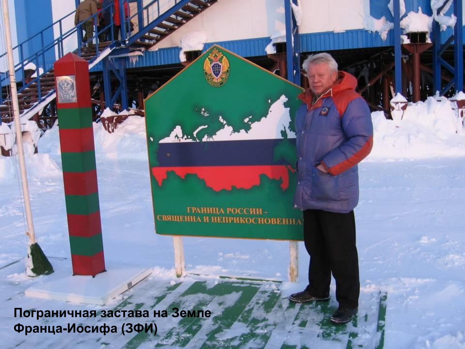
Пограничная застава на Земле Франца-Иосифа (ЗФИ)