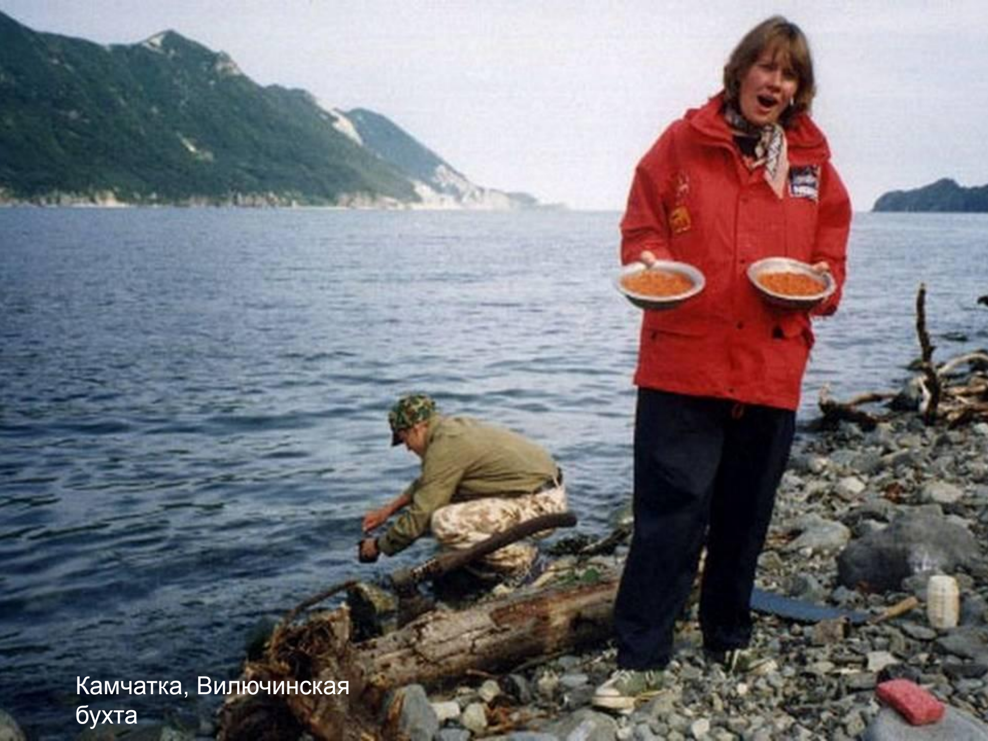
Камчатка, Вилючинская бухта