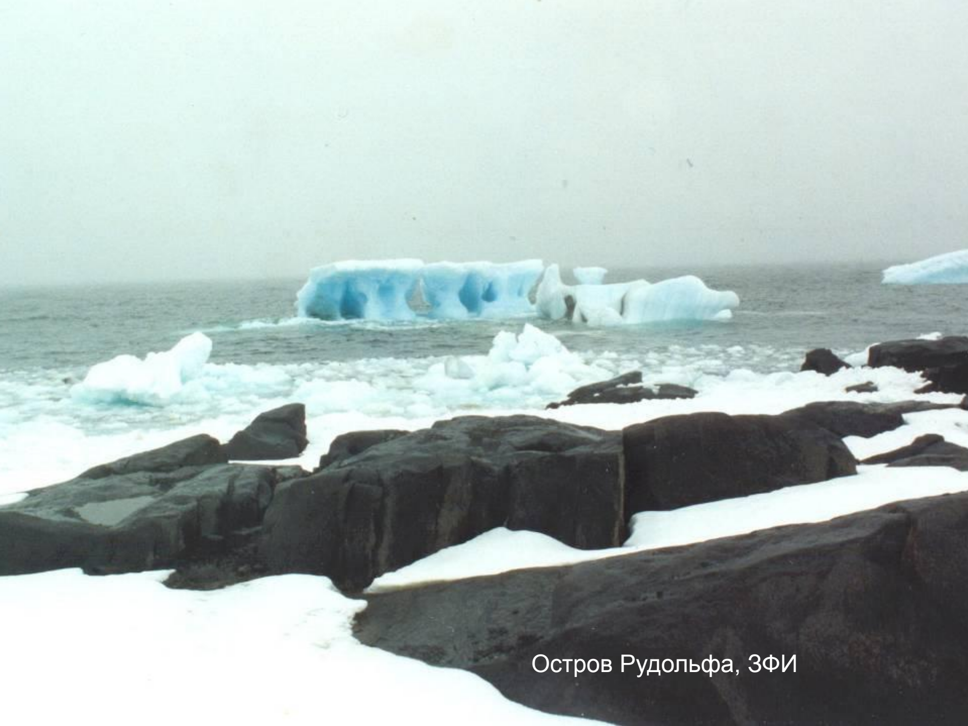
Остров Рудольфа, ЗФИ