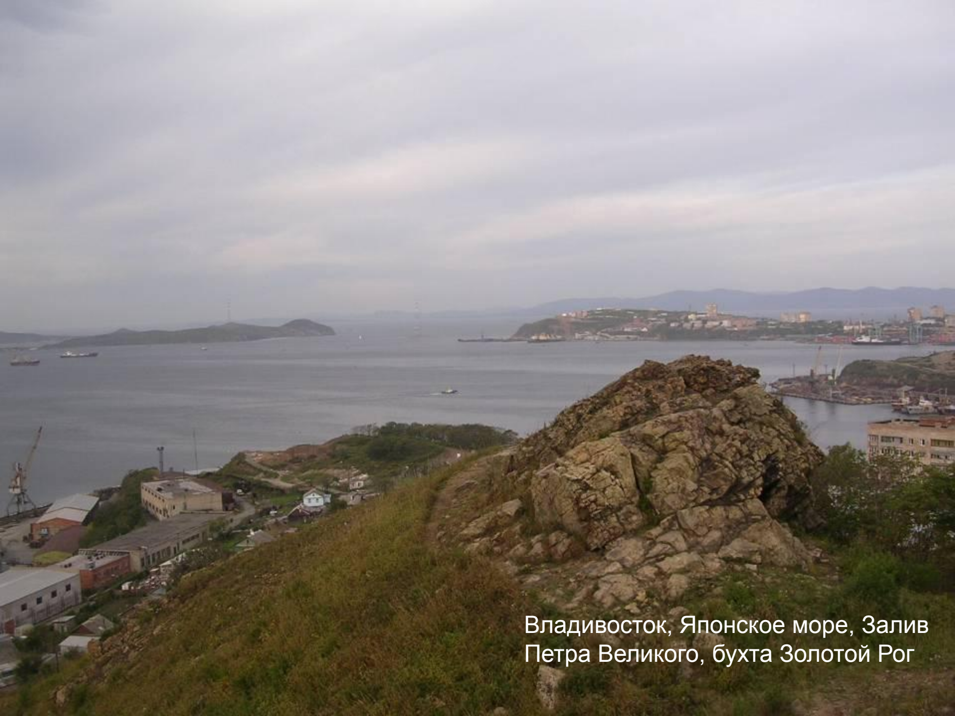
Владивосток, Японское море, Залив Петра Великого, бухта Золотой Рог