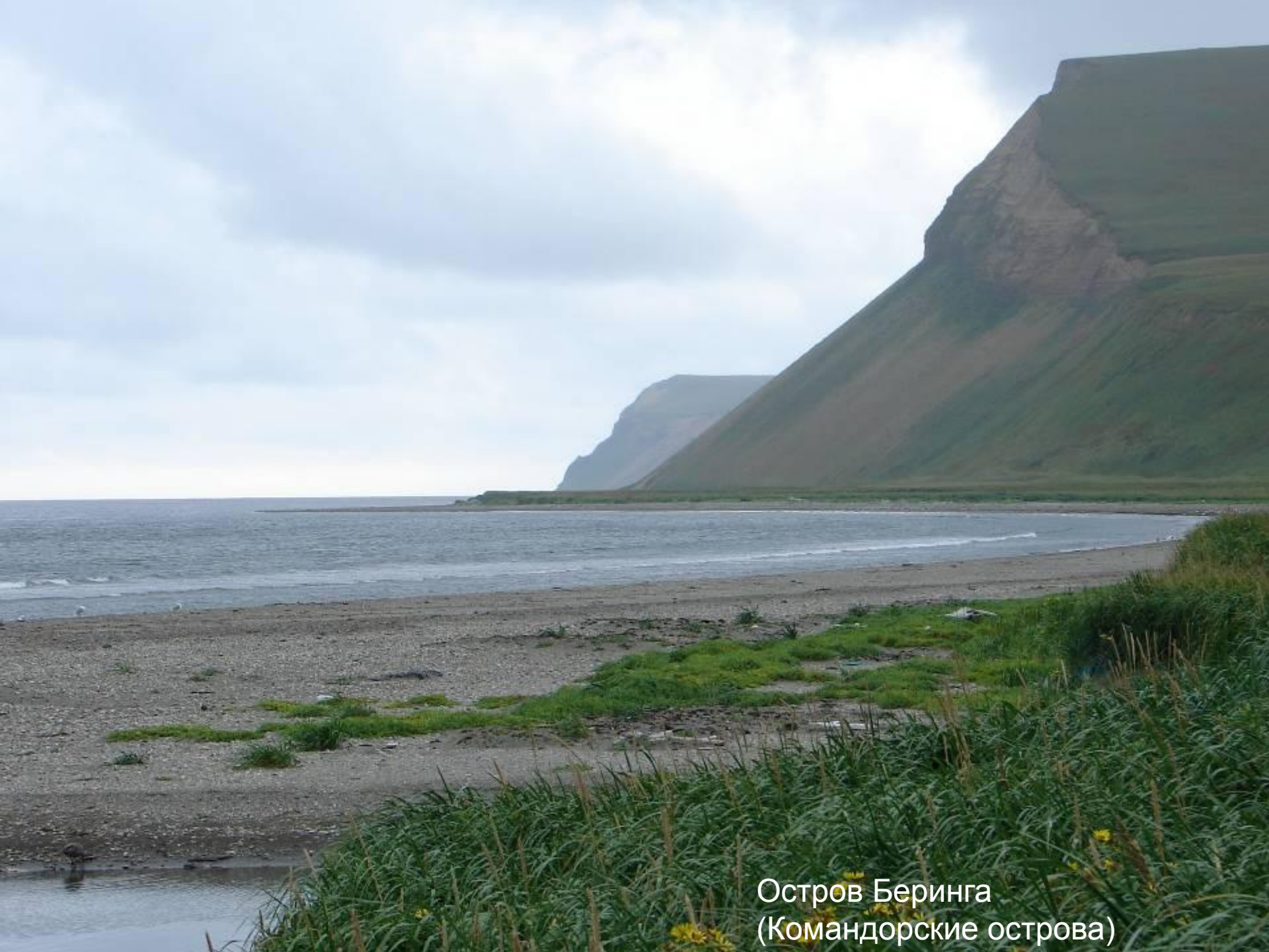
Остров Беринга (Командорские острова)