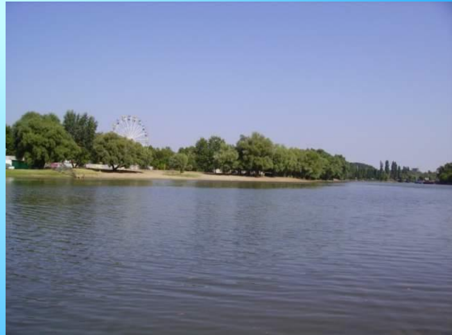
Кубань в нижнем течении