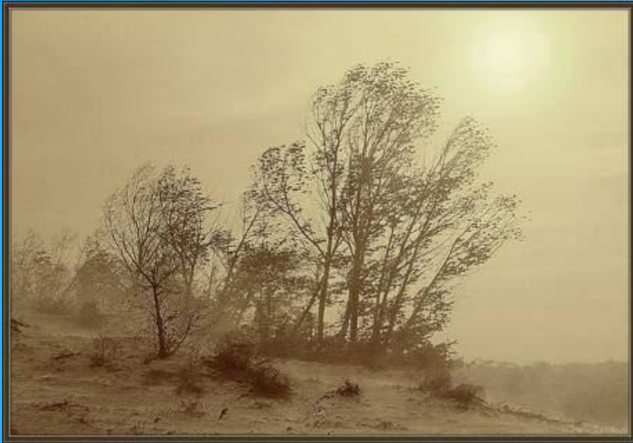
Пыльная буря в Прикаспии