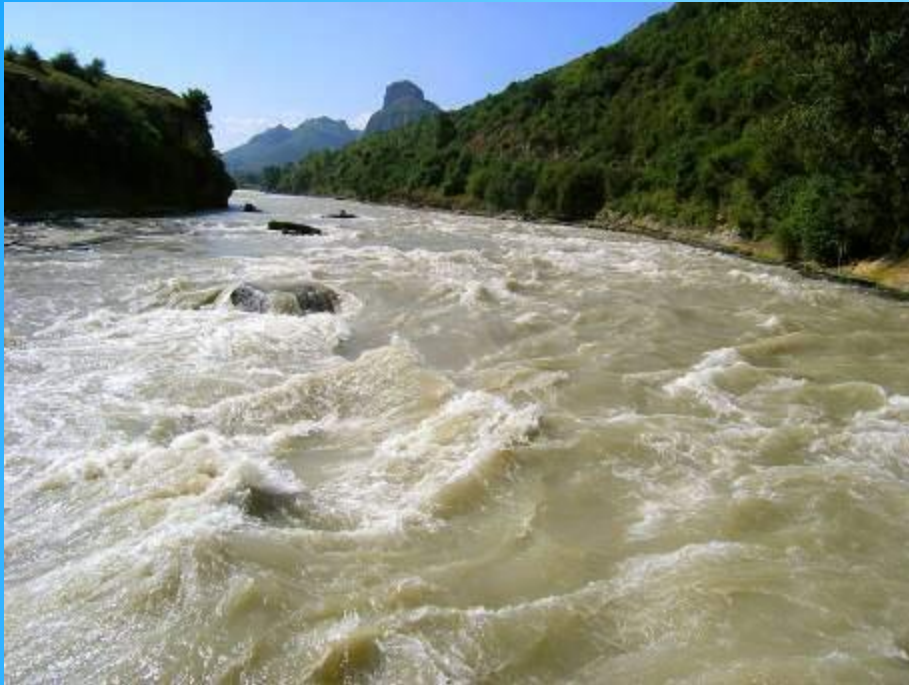
Кубань в верхнем течении