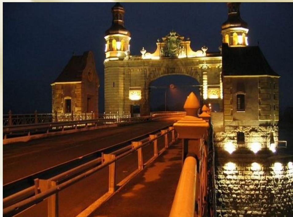
Граница с Литвой. Советск. Мост королевы Луизы