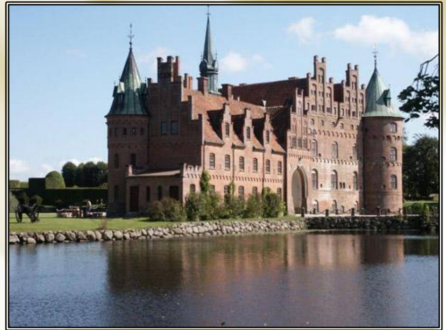
Замок Эгескув. Зеландия. Дания