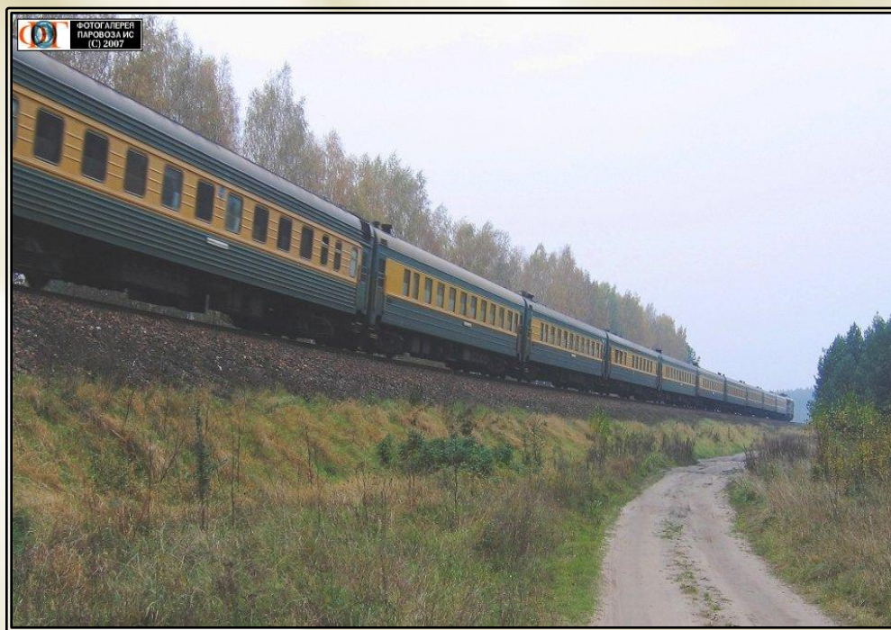
Поезд Санкт-Петербург - Калининград