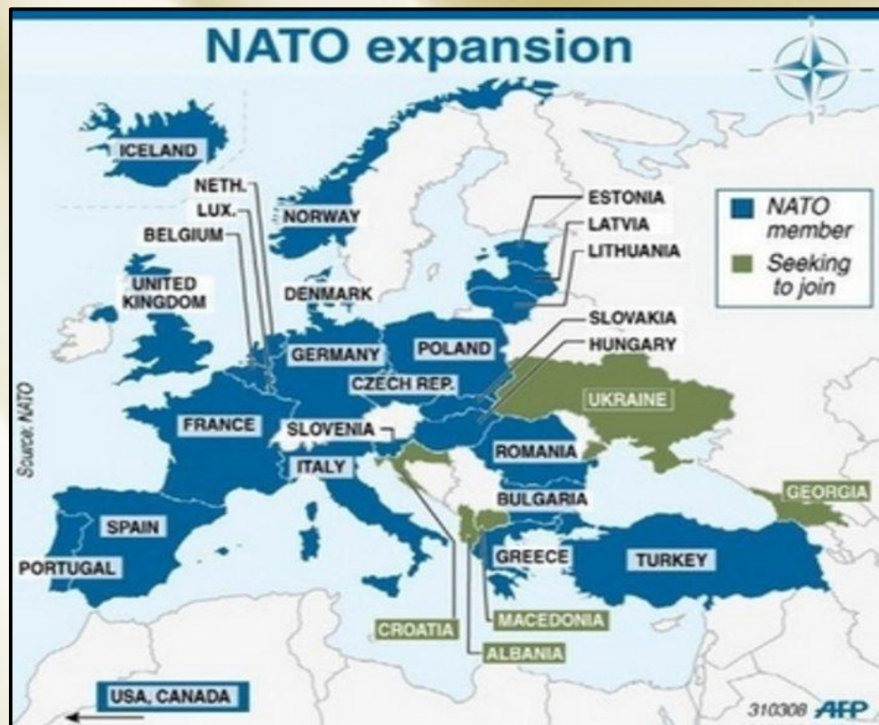
Страны-члены НАТО и желающие вступить в блок