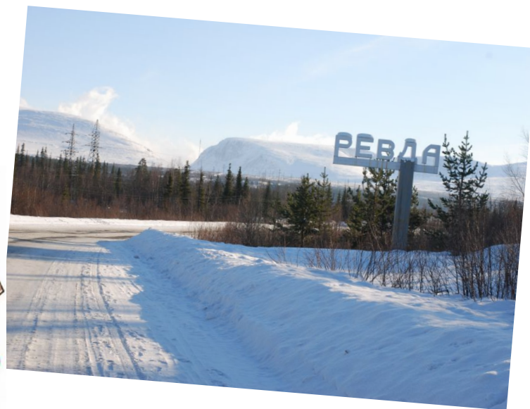
Построен горняцкий посёлок. Посёлок, что Ревдой зовут.