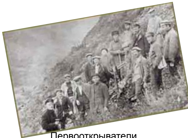
Первооткрыватели Ловозеских тундр Март 1948 г.