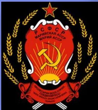
Герб Марийской АССР