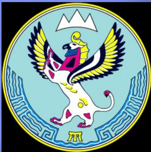
Герб Республики Алтай