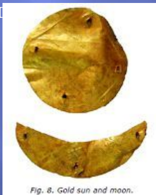
Золотой герб государства Хунну