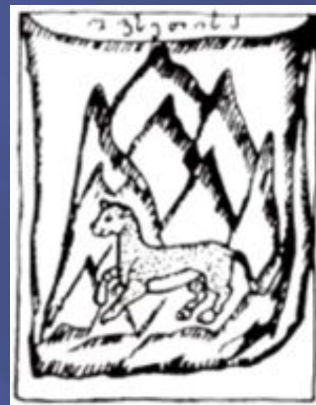
«Знамя Осетии» Вахушти Багратиони, XVIII век