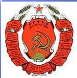
Герб Дагестанской АССР