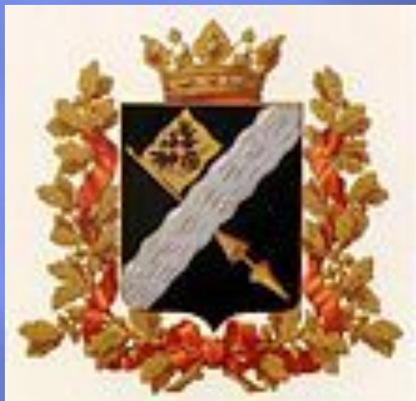
Герб Терской области