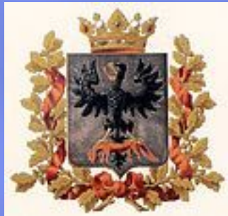
Официальный герб области (изд. МВД, 1880)