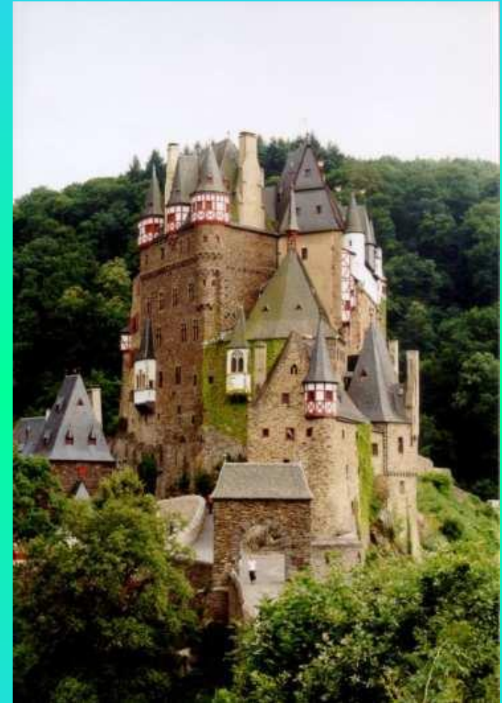
Замок Эльц на Мозеле (Рейнланд-Пфальц)