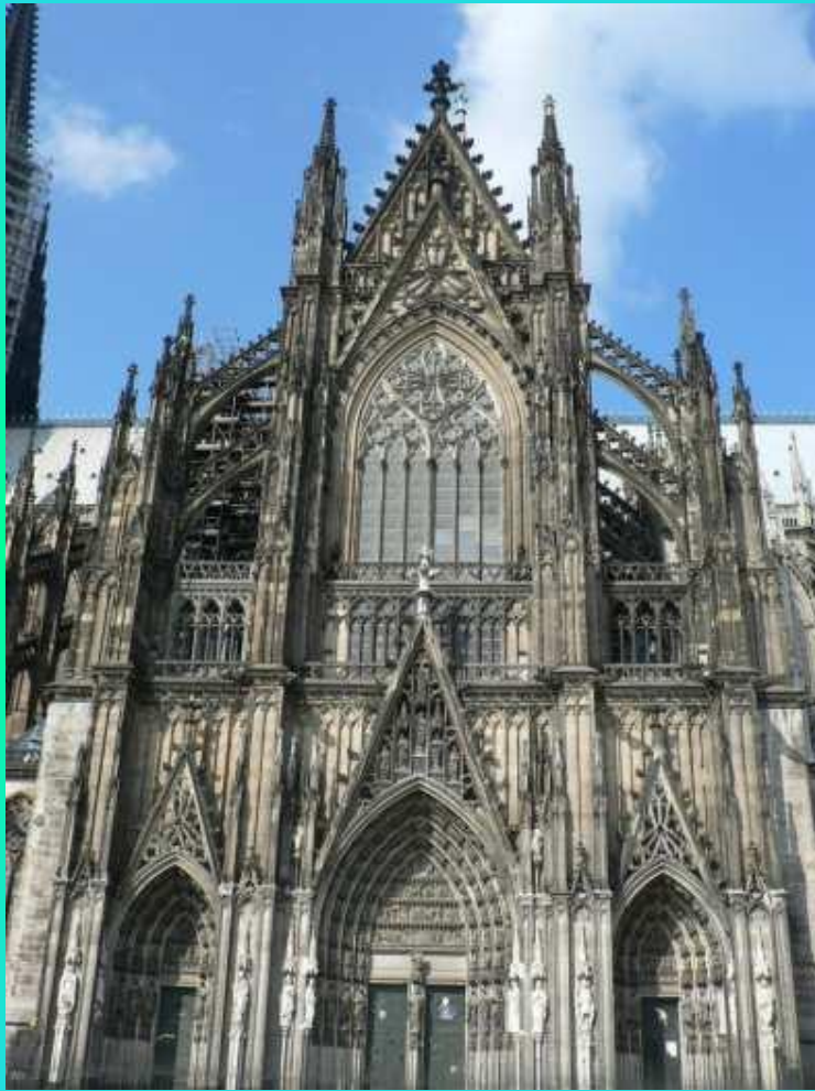
Кёльнский собор, Кёльн (Северный Рейн — Вестфалия)