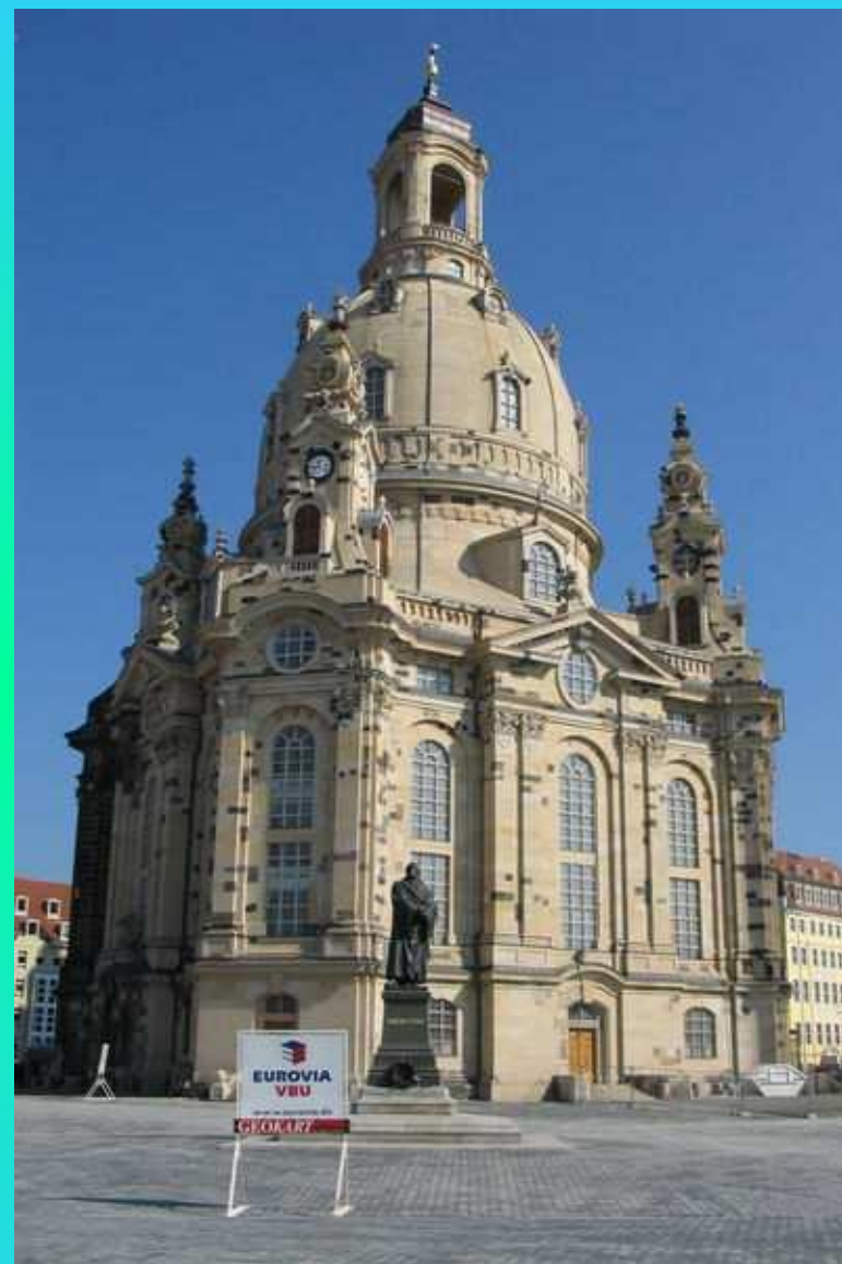
Фрауэнкирхе, Дрезден (Саксония)