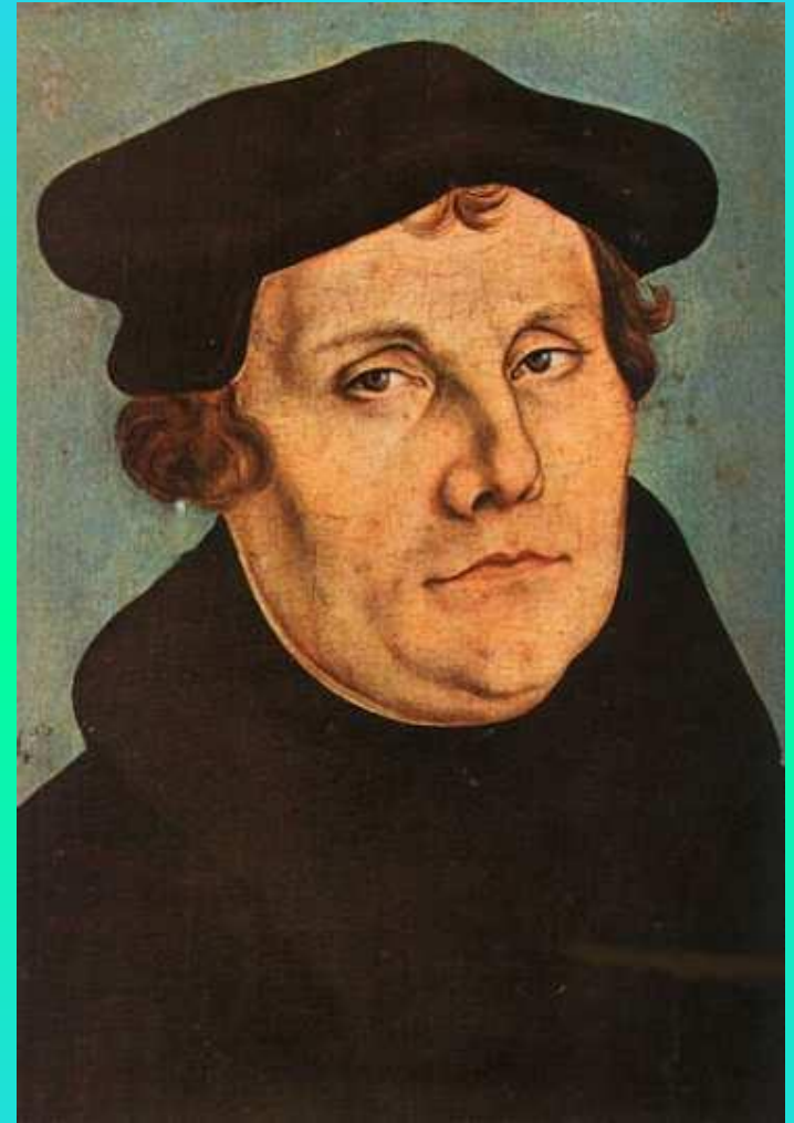
Мартин Лютер — основатель немецкого протестантизма (лютеранства)

Небольшая часть верующих принадлежит к христианским деноминациям — баптисты, методисты, верующие Новоапостольской Церкви и приверженцы других религиозных течений.