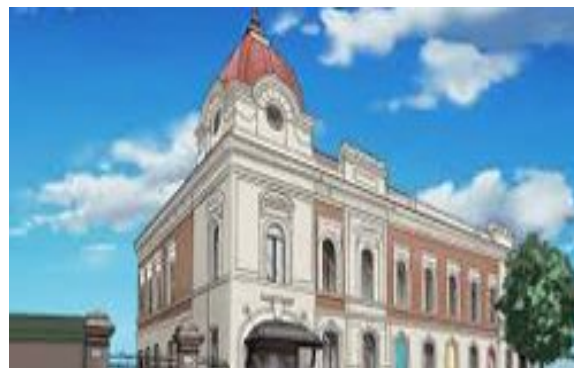
Татарский театр драмы и комедии