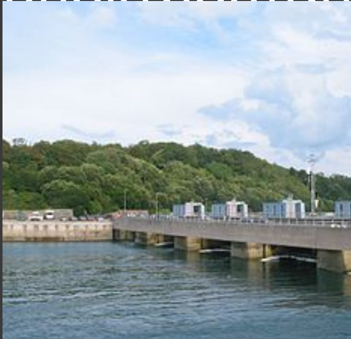
Крупнейшая в Европе приливная электростанция Ля Ранс, Франция