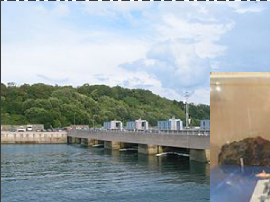
Крупнейшая в Европе приливная электростанция Ля Ранс, Франция