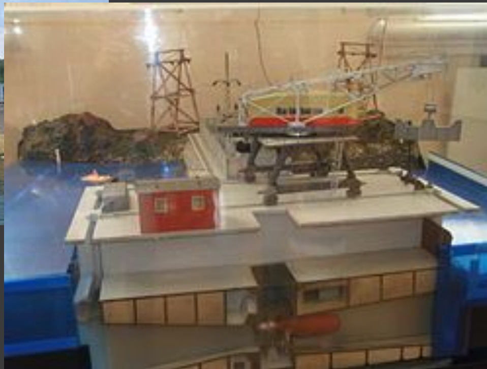
Макет Кислогубской приливной электростанции,