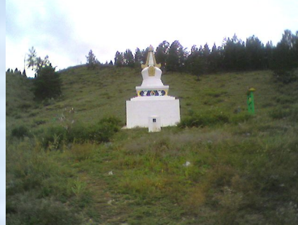
Шэнэһэтэ The Grove Shenehete