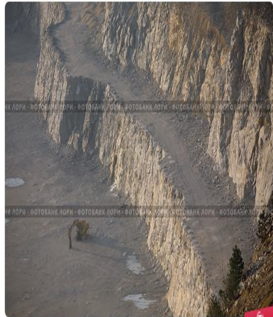
Добыча полезных ископаемых открытым способом