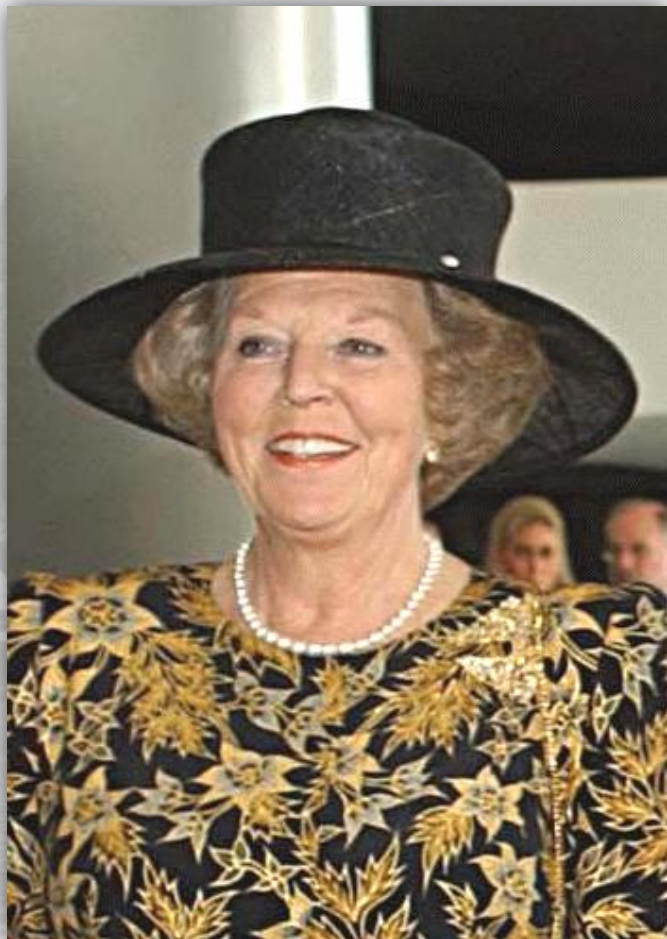
Королева Беатрикс официально является главой государства