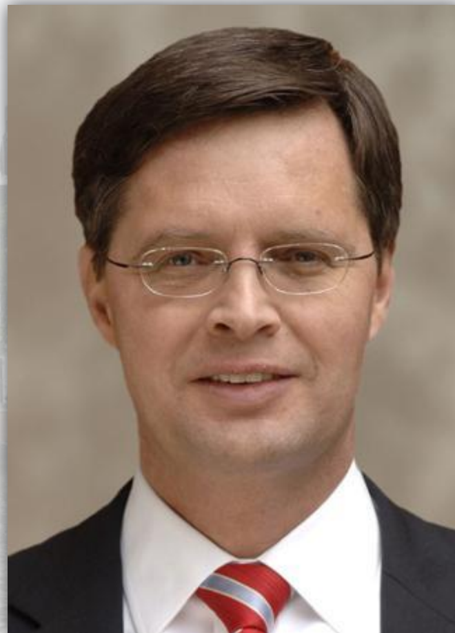
Исполнительная власть принадлежит правительству во главе с премьер-министром Балкененде