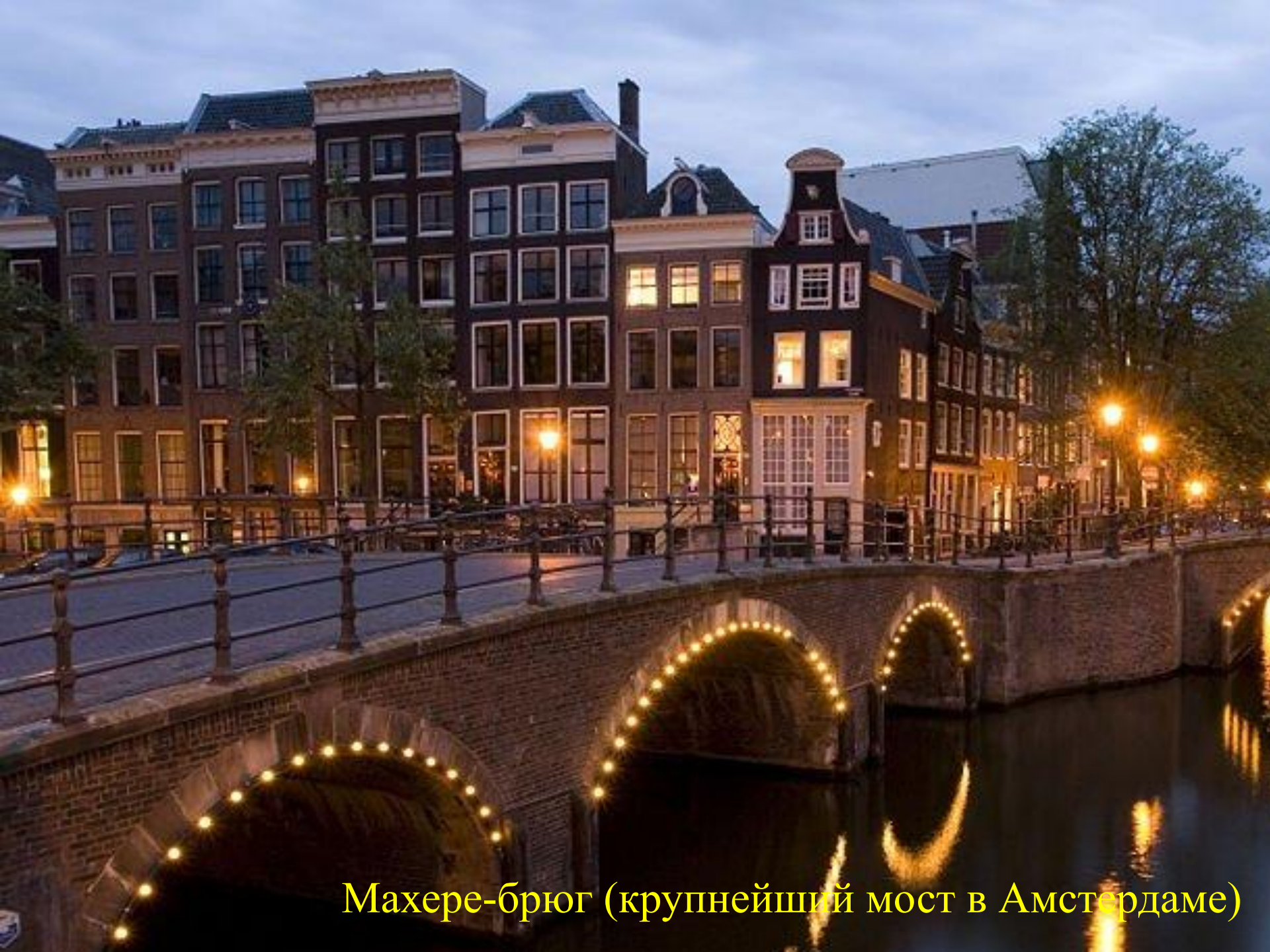
Махере-брюг (крупнейший мост в Амстердаме)