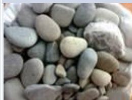
гравий, галька, валуны