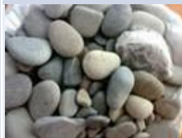
гравий, галька, валуны