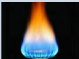
нефть и газ