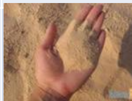
песок и глина

К ним относят породы, содержащие собственно обломки пород и минералов и продукты их механического (физического) преобразования — окатанные зерна пород и минералов.