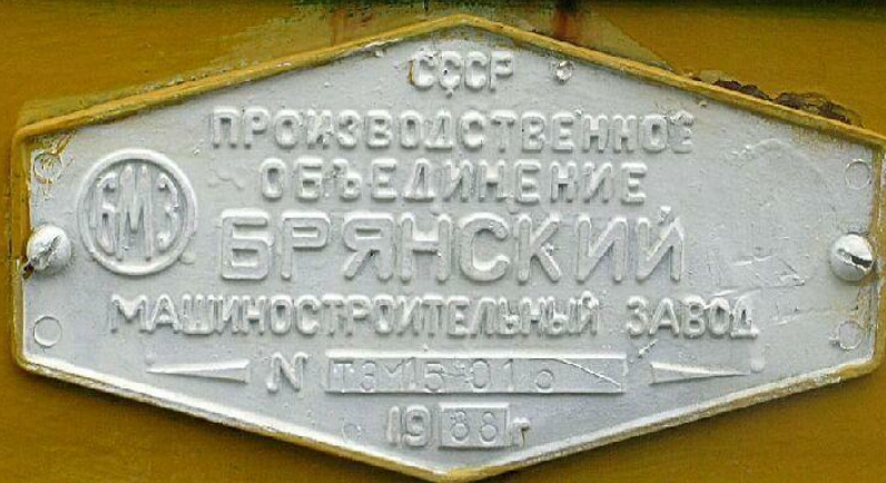
Табличка на тепловозе ТЭМ15 в музее на ст.Сеятель