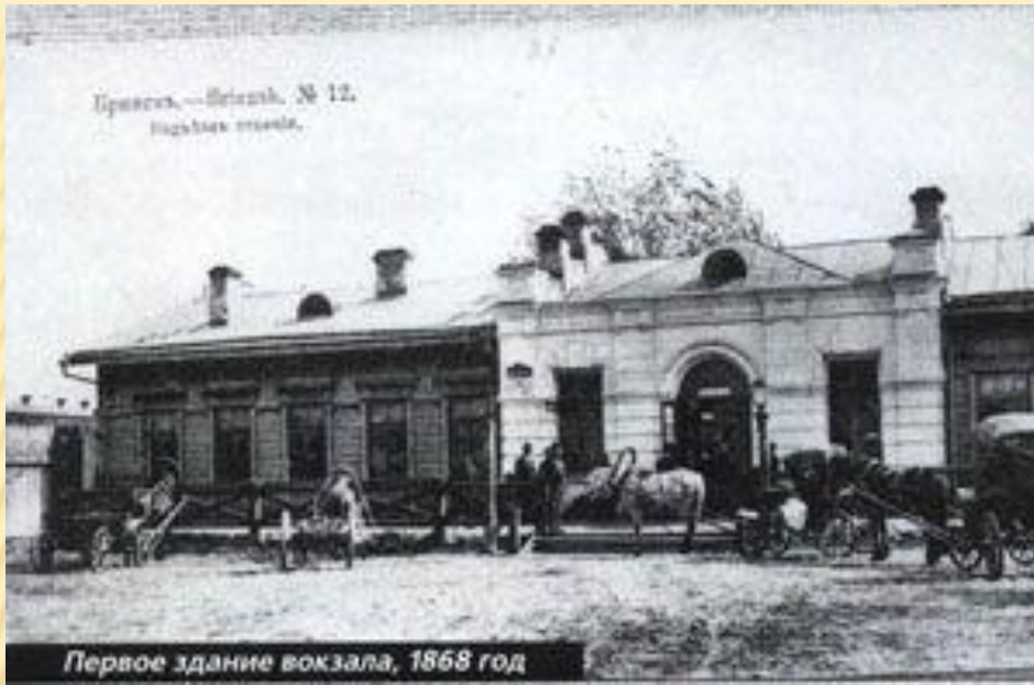
Первое здание вокзала, 1868 год