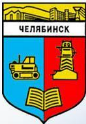
Герб советского периода