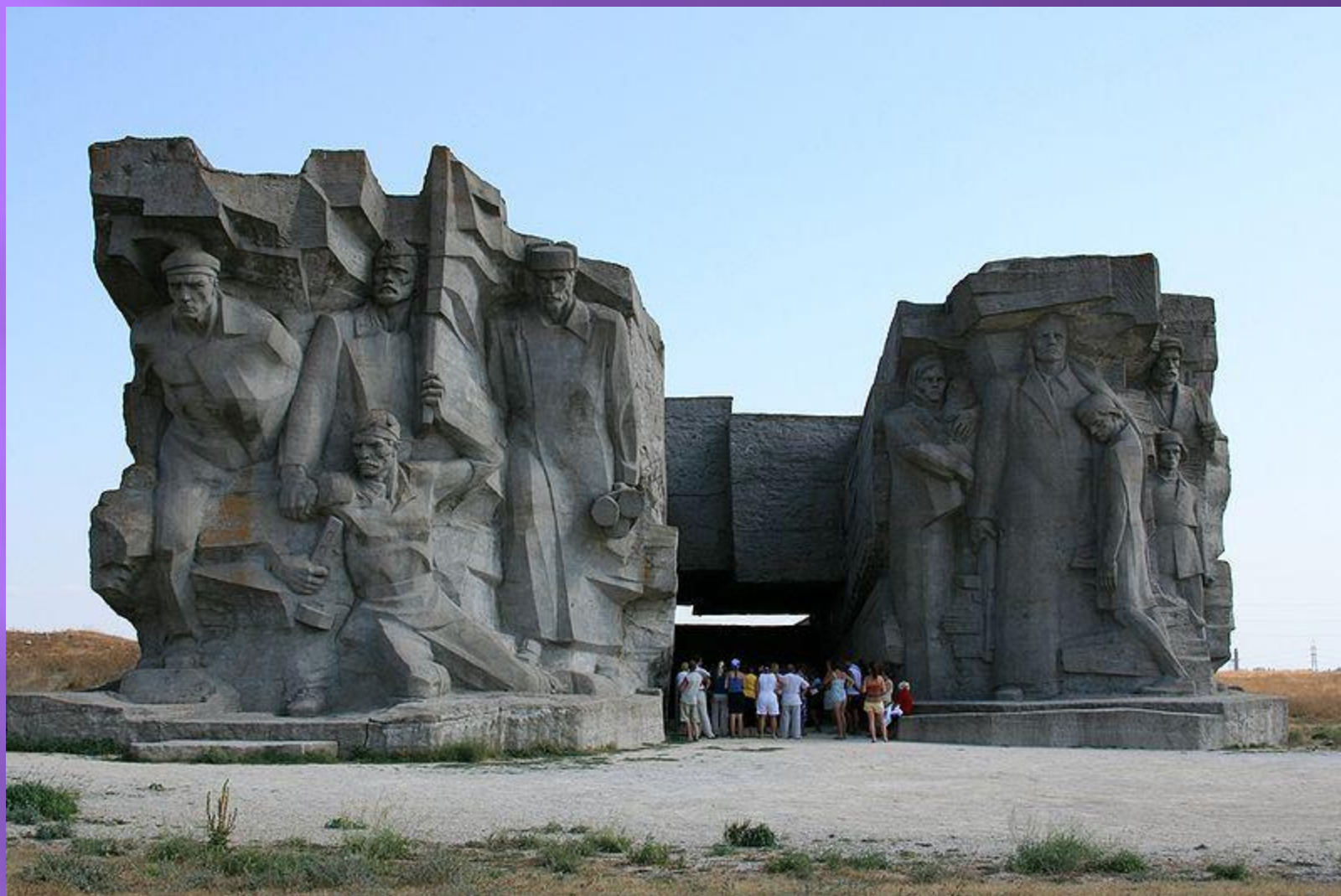
Композиция над музеем обороны Аджимушкайских каменоломен