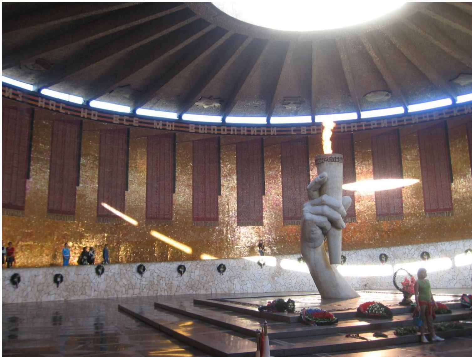
В Зале Воинской Славы звучит музыка, горит Вечный огонь