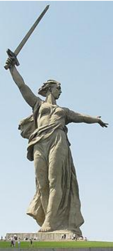
Монумент «Родина-мать зовёт»