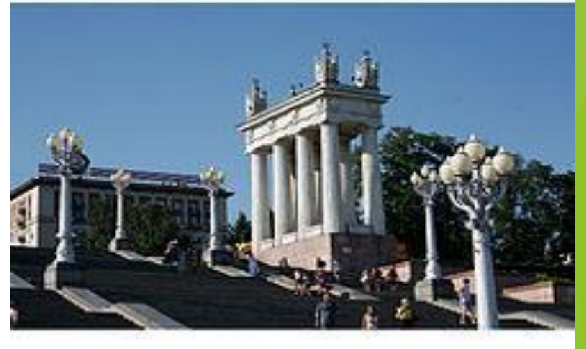
Набережная имени 62-й армии.

( http://www.youtube.com/watch?v=Vy9Zak86e6c )