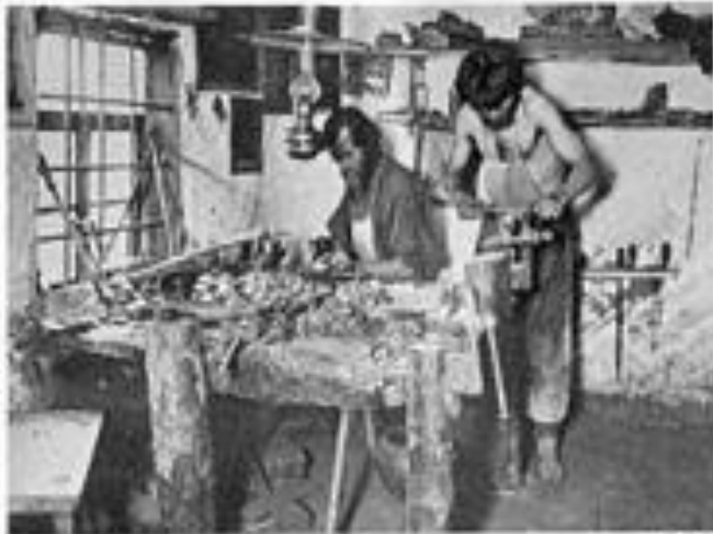
Производство железных изделий. — Fabrication de métaux au marteau. — Павлов, Павлов. — — Pavlov et Pavlov de Pavlov et Pavlov.

В XVII веке в Павлове преобладали оружейные мастера и замочники