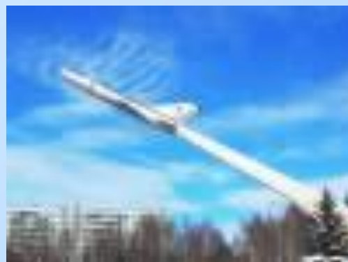
Скульптурная композиция «Самолет»