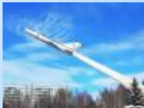
Скульптурная композиция «Самолет»