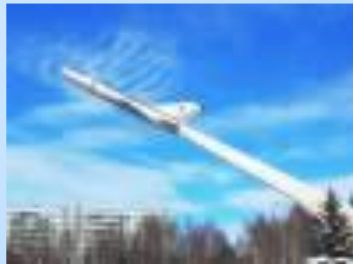
Скульптурная композиция «Самолет»