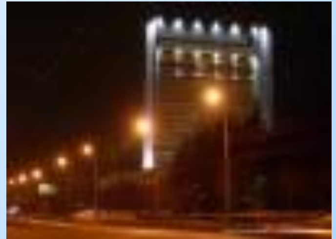
Высотка на проспекте Победы