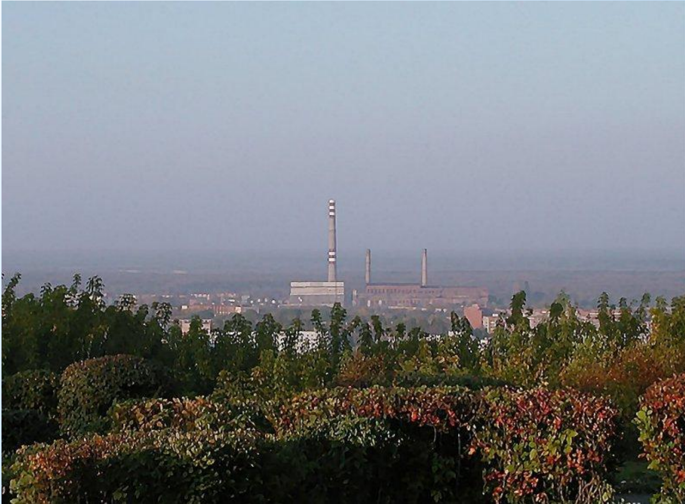
Вид со смотровой площадки