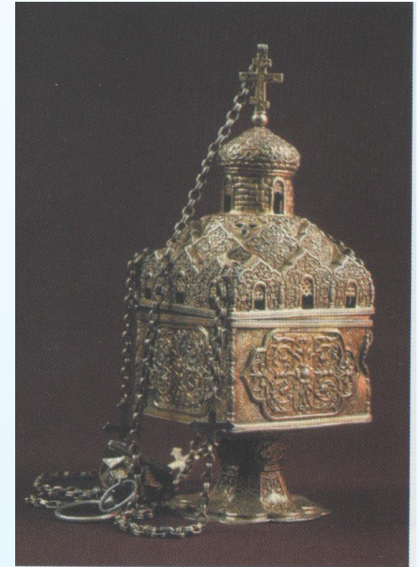
Экспонаты ростовского музея - заповедника