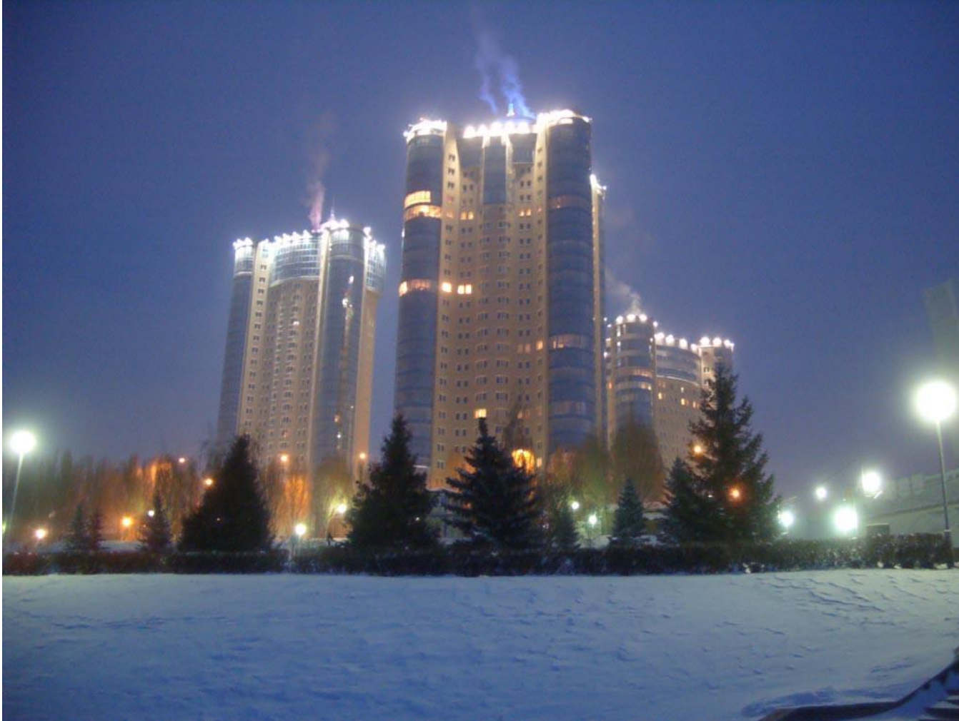
Жилой комплекс «Ладья», уютно расположившийся на берегу Волги.