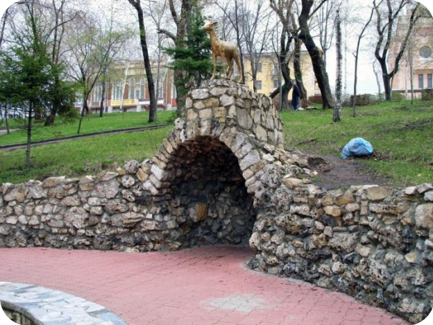
Струковский сад - старейший парк Самары, расположенный на берегу Волги

Самарский государственный экономический университет Samara state