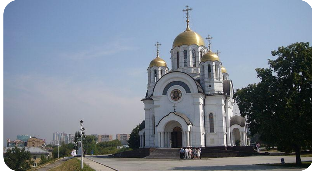
Постоянный пользователь. Моя Самара. Храм св. Георгия Победоносца

Самарский государственный экономический университет Samara state